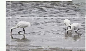
採餌中のクロツラヘラサギ