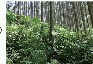
間伐後 (明るく下草が豊かな森林)