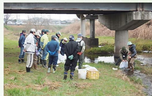
ほたるアドバイザー