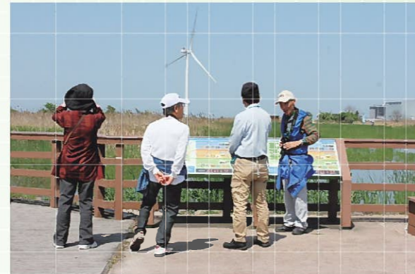
ビオトープ園内で活動する響灘ビオトープボランティア

これまで、平成17年度～平成21年度（5年間）にかけて、講義や実習を実施し、195名が「北九州市自然環境サポーター」として認定された。 こうして育成された「自然環境サポーター」は、里地里山での植樹活動、希少種の保全活動、自然観察講座の運営補助など幅広い活動を行った。 また「響灘ビオトープボランティア」として33名活動中。