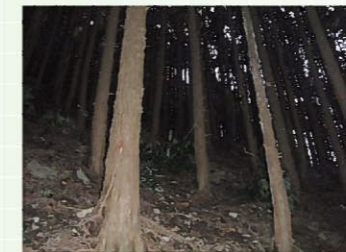
間伐前 (暗く下草がない森林)