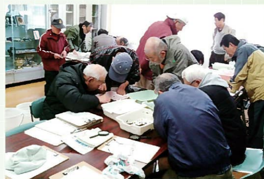
ほたと水辺の環境学習会