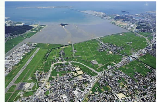
曾根干潟に飛来したクロツラヘラサギ

関係団体と連携し、情報収集に努める。また、地元・関係者と行政との協議の場を設け、意見の聴取を図る。 市においても、定期的なモニタリング調査を実施し、干潟環境の把握に努め、必要に応じて保全策を講じる。