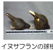
イヌサフランの球根

イヌサフランとは、別名コルチカムとも呼ばれます。球根は径3〜5センチの卵形で、アヤメ科のサフランに似た花をつけます。毒性成分は、アルカロイドのコルヒチンであり、 嘔吐、下痢、皮膚の知覚減退、呼吸困難 などの症状をもたらす、重症の場合には死亡することもあります。球根がニンニクやタマネギ、ジャガイモ、ミョウガ等と似ていることから、 誤食による食中毒 が発生しています。