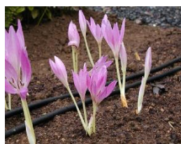
イヌサフランの花