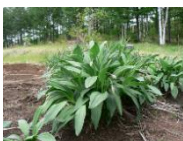
ギョウジャニンニクの葉

令和3年5月、小樽市において、自宅付近に生えていたイヌサフランを、食用のギョウジャニンニクと誤って喫食したことによる食中毒が発生し、1人が死亡しました。イヌサフランの葉は、ギョウジャニンニクの葉と似ているため、注意が必要です。