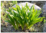
イヌサフランの葉