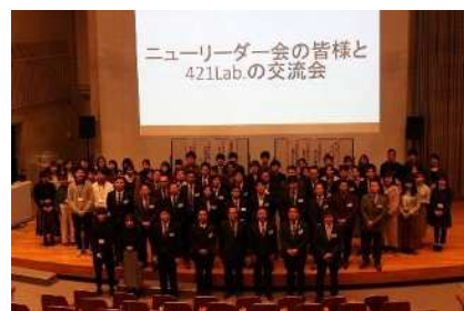
若手経営者と地域学生との交流事業 ひびしんニューリーダー会 ×北九州市立大学421Lab.