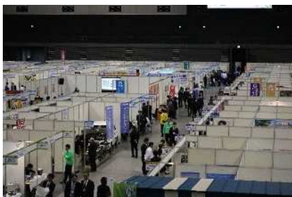
九州北部信用金庫協会主催 第5回しんきん合同商談会