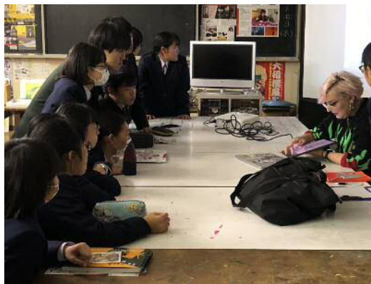
市内高校でのスクールレクチャー