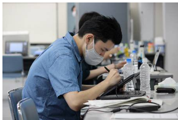
日中韓新人漫画選手権 作品制作の様子