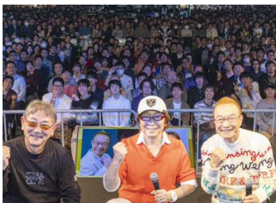
人気声優によるステージイベント