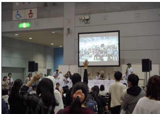
ステージイベント