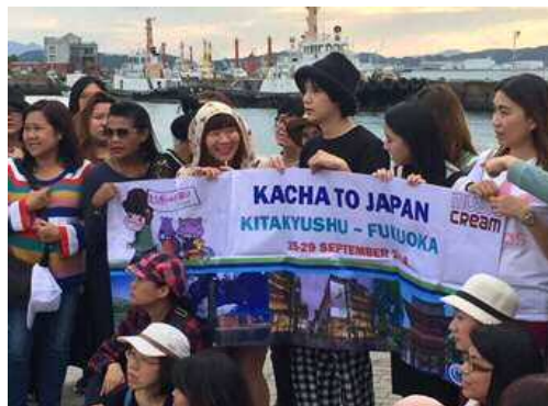
タイの人気アーティストの 本市でのファンツアーの様子