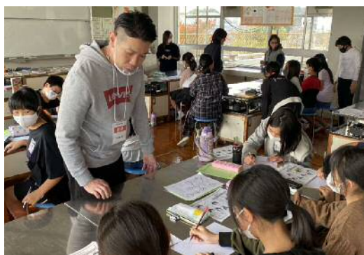
小学校での指導の様子