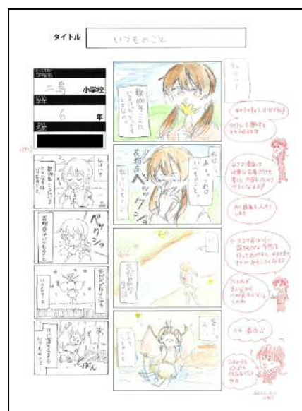
児童の作品をプロ漫画家が添削