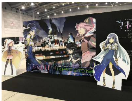
人気アニメと本市の夜景とのコラボ企画