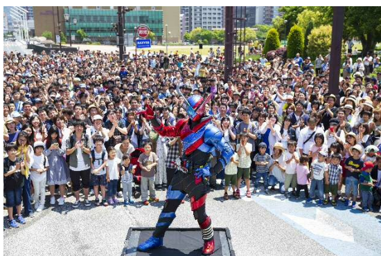
3000 人のエキストラが参加した映画撮影 (平成 30 年度 仮面ライダービルド)

北九州フィルム・コミッションによる国内外の映画作品等の誘致、支援活動を実施した。また、支援作品を利用し、舞台挨拶や映画関連イベント、インバウンド促進事業等を実施し、国内外に本市の映画文化を発信した。