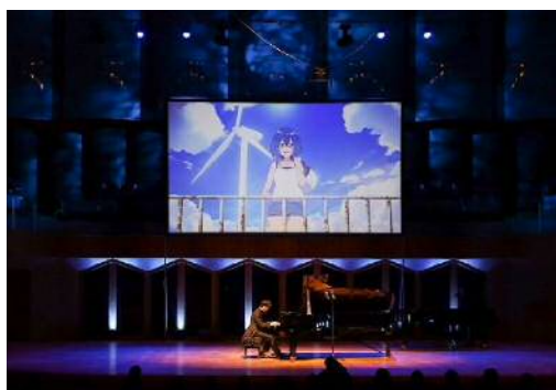
アニメ映像を活用した演出