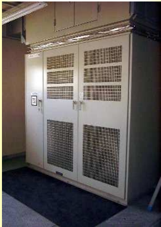
高圧インバータ機器