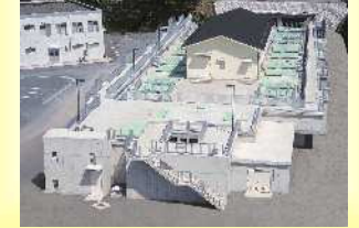
高度浄水施設（六生浄水場）

川に生息する微生物の持つ浄化作用を活用する施設で、これまで困難だったカビ臭など異臭味の除去に効果があります。おいしい水を作るとともに、薬品使用量の削減にも寄与しています。 本城浄水場、六生浄水場