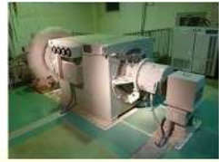
ます淵水力発電所 ※売電を目的とした取組では、西日本の水道事業者で初めてです。