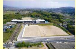
汚水汚泥の有効利用：令和2年度100%達成