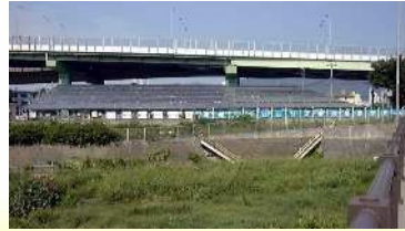
紫川太陽光発電 ※新エネルギー大賞（会長賞）を受賞