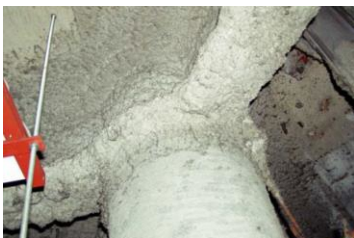
柱や梁に施工 吹付け石綿