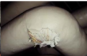
エルボ部に使用 石綿含有保温材