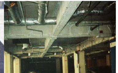
鉄骨を被覆して保護 石綿含有耐火被覆材