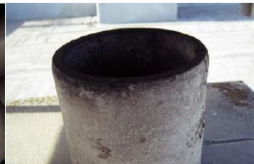
煙突の内側に使用 石綿含有断熱材