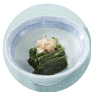
ほうれん草のおひたし