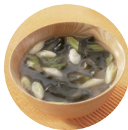
具だくさんのみそ汁