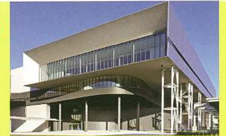
2021年度開所 安川テクノロジーセンター