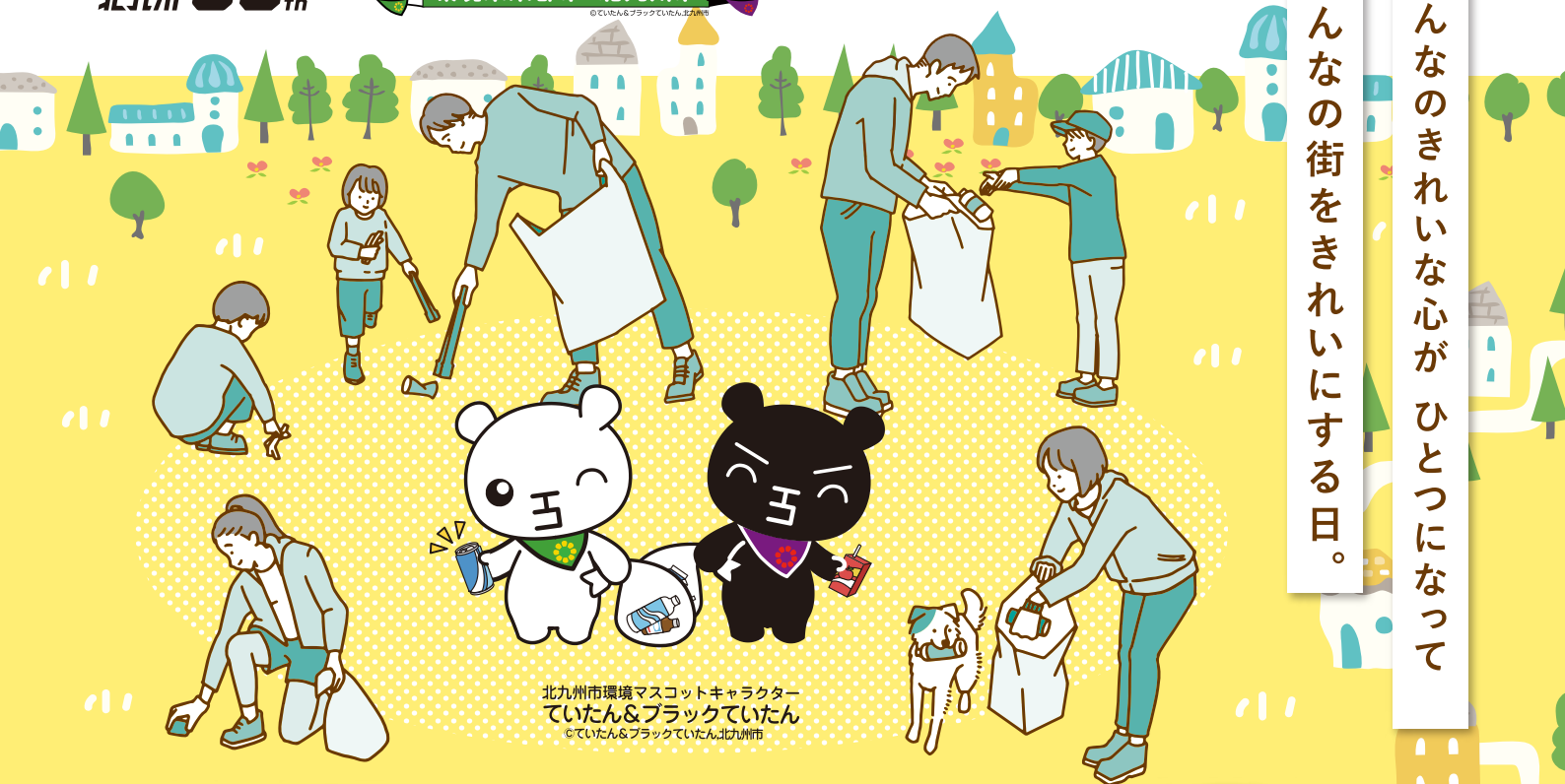
北九州市環境マスコットキャラクター ていたん&ブラックていたん ©ていたん&ブラックていたん北九州市