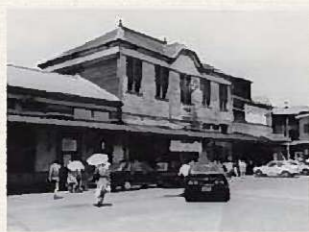
▲昭和 48 年頃折尾駅舎外観