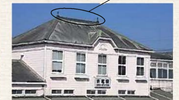
▲旧駅舎の棟飾り(中央の棟飾りがない)