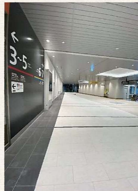
▲駅構内(筑豊本線側)