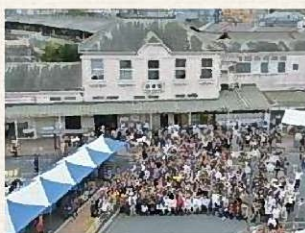
▲ありがとう折尾駅舎 (解体直前にイベントを開催)