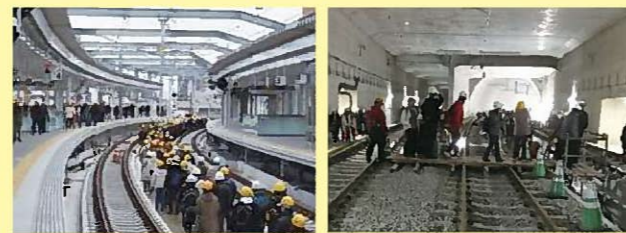
▲高架&トンネルウォーク (事業進捗の実感と賑わいづくりを目的として開催)