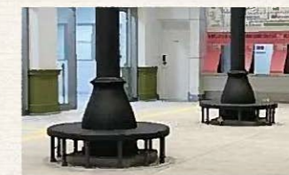
▲新駅舎の円形ベンチ、化粧柱

旧駅舎には円形ベンチが2つありました。既存のベンチは再利用できる部材を可能な限り活用しており、平成24年の解体時に残ってなかった右側のベンチは再現し設置しました。