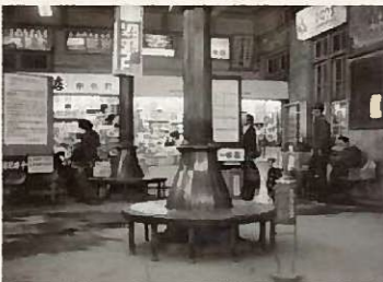
▲旧駅舎の待合室 (昭和50年 藤崎 吉弘氏 提供)