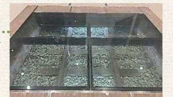
▲旧筑豊本線レール展示