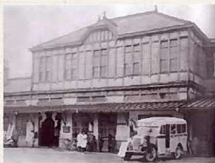
▲昭和 9 年頃折尾駅舎外観