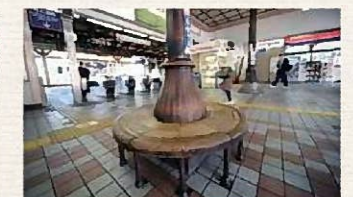
▲旧駅舎の円形ベンチ、化粧柱 (左側:ベンチ有、右側:ベンチ無)