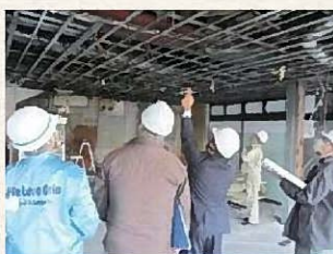
▲専門家による解体調査