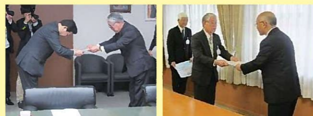
▲要望書の提出 (左：市への提出、右：JR 九州への提出)

平成 24 年：おりお未来 21 協議会が市・JR 九州へ 「折尾駅舎保全・活用に関する要望書」 を提出