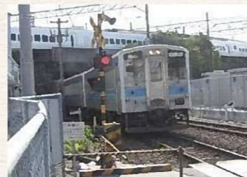
▲立体交差 (上が鹿児島本線、下が筑豊本線)

新駅舎の駅構内空間には、日本初の立体交差が折尾にあったことを後世に伝えるために様々な工夫を凝らしています。