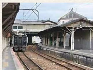
▲解体直前の駅構内 (筑豊本線ホームの様子)