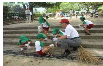
まち美化活動の様子

自治会の加入促進や市民活動団体の育成、市民センターの維持管理を進めるほか、マイナンバーカードの普及促進等にも取組みます。