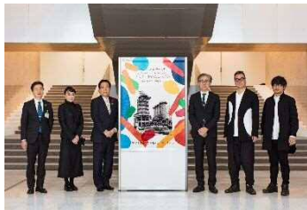
「北九州未来創造芸術祭ART for SDGs」企画発表 (R.2.10.26)

「東アジア文化都市北九州」を開催し、文化芸術による「創造都市・北九州」の実現に取組みます。