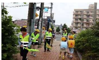
生活安全パトロールの様子

地域や事業者等の自主防犯活動の活発化を図り、警察等と連携しながら安全・安心なまちづくりの推進に取組みます。