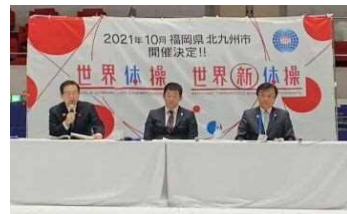
「2021世界体操・新体操選手権北九州大会」 開催決定記者会見(R.2.11.8)

東京2020オリンピック・パラリンピック関連事業や2021世界体操・新体操選手権など「みる」スポーツの機会創出に取組みます。