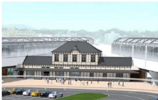
【新折尾駅舎外観 (H24 公表イメージ)】

折尾駅が新しくなり、これまでのエレベータに加え、エスカレータが新たに設置されます。 また、筑豊本線と鹿児島本線が連絡通路を通過、スムーズな移動ができるようになります。