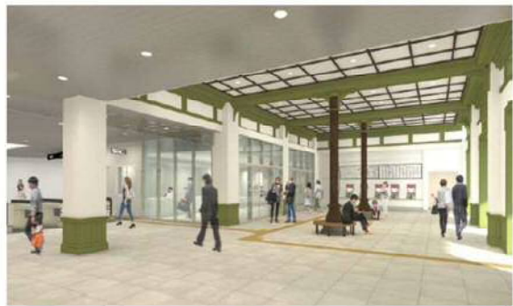
【新折尾駅構内 (イメージ)】