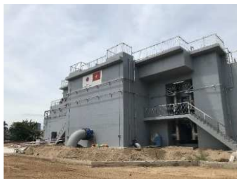
高度浄水処理技術のベトナム受注例