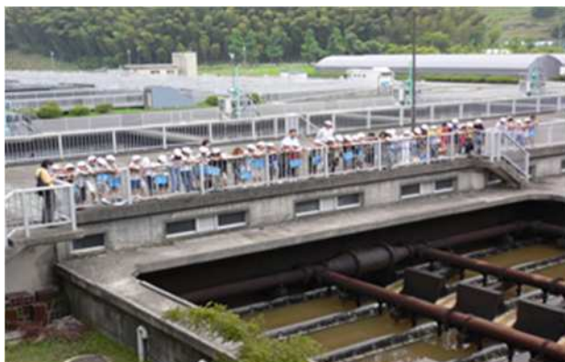
井手浦浄水場のろ過池を見学する小学生