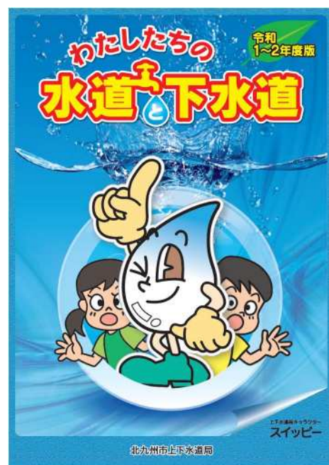
小学校3・4年生を対象とした副読本