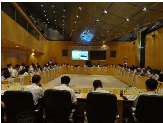
広域連携に関する勉強会