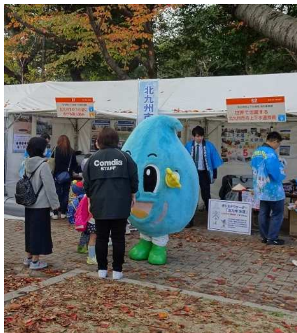
イベント(エコライフステージ)への参加