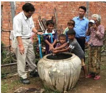
カンボジア地方部での水道整備支援