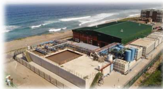
海淡・下水再利用統合システム (南アフリカ共和国・ダーバン市)

ダーバン市での運用を皮切りに、今後、水不足に悩む世界各地への進出が期待されます。