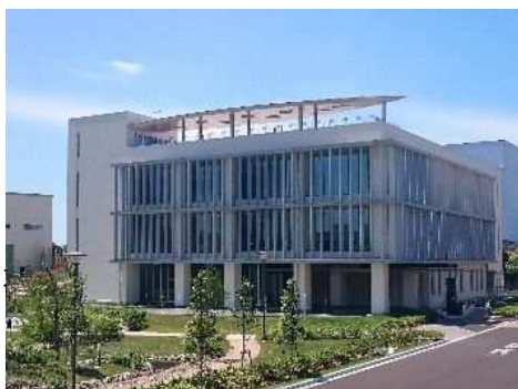
水ビジネスの国際戦略拠点 (ビジターセンター)