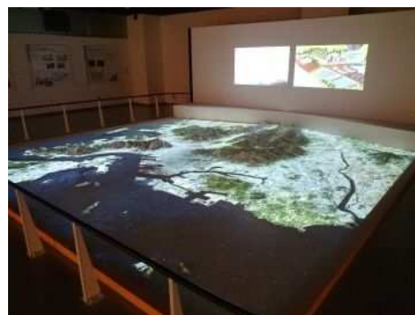
ジオラマシアター (プロジェクションマッピング)

また、小中学生の環境教育の場として、下水道を楽しく学べるジオラマシアターや、73mm/hの豪雨を体験できる降雨体験装置などを備えた体験型施設でもあります。