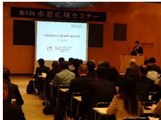
水道広域セミナー