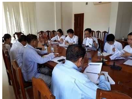
下水道の基本政策について、カンボジア政府と協議