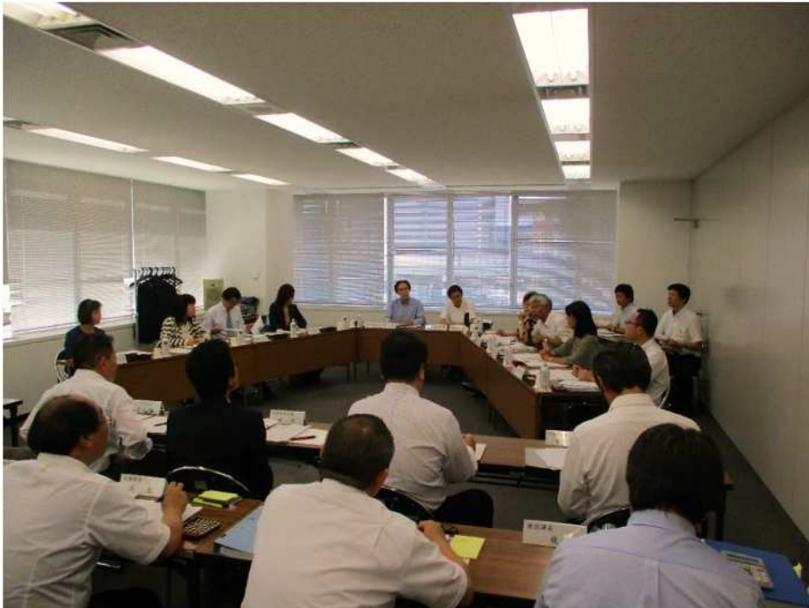
北九州市上下水道事業検討会の様子