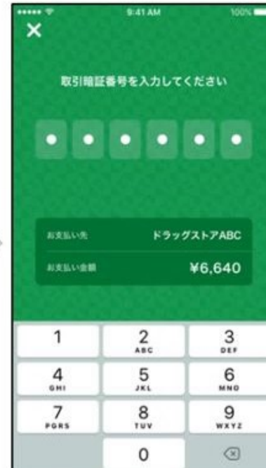
4. 取引暗証番号を入力する