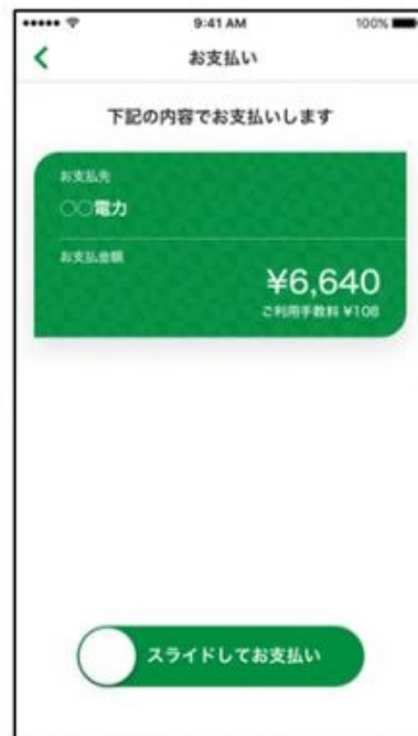
3. 読み取ったバーコードに紐づく お支払先、お支払金額、手数料を表示 する。スライドしてお支払い