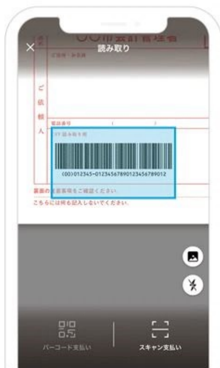
2. 払込票のバーコードを読み取る