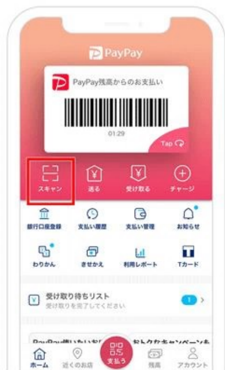
1. アプリのホーム画面にある「スキャン」をタップ