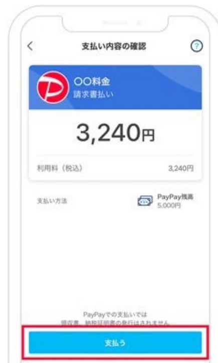
3. 支払金額を確認し「支払う」をタップ