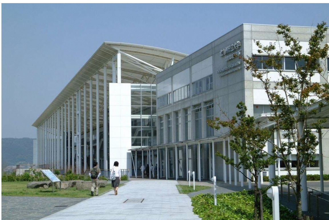
「ひびきのキャンパス」