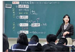
毎時間、生徒の発言が楽しみです！