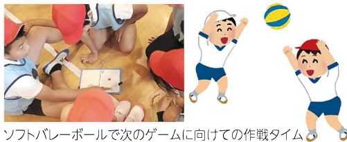
ソフトバレーボールで次のゲームに向けての作戦タイム