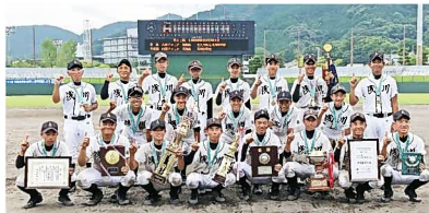
▲浅川中学校野球部