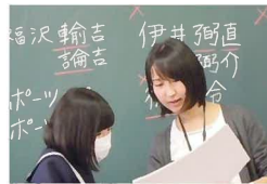
質問には、わかるまで丁寧に説明するよう心がけています！