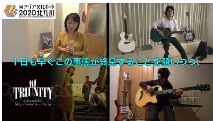
「夜明けを待っている」(TRIUNITY)