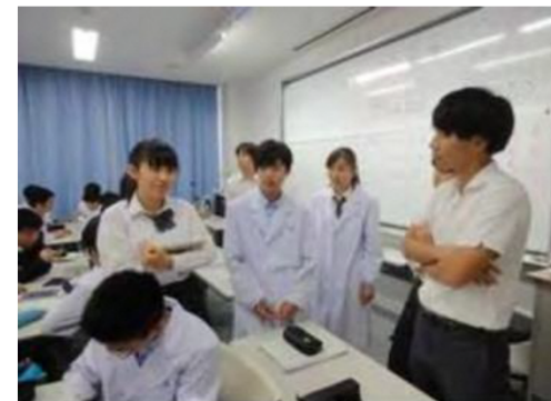
サイエンスリテラシーⅠ「結晶の生成と比較対照実験」において、大学教員から指導を受けている様子