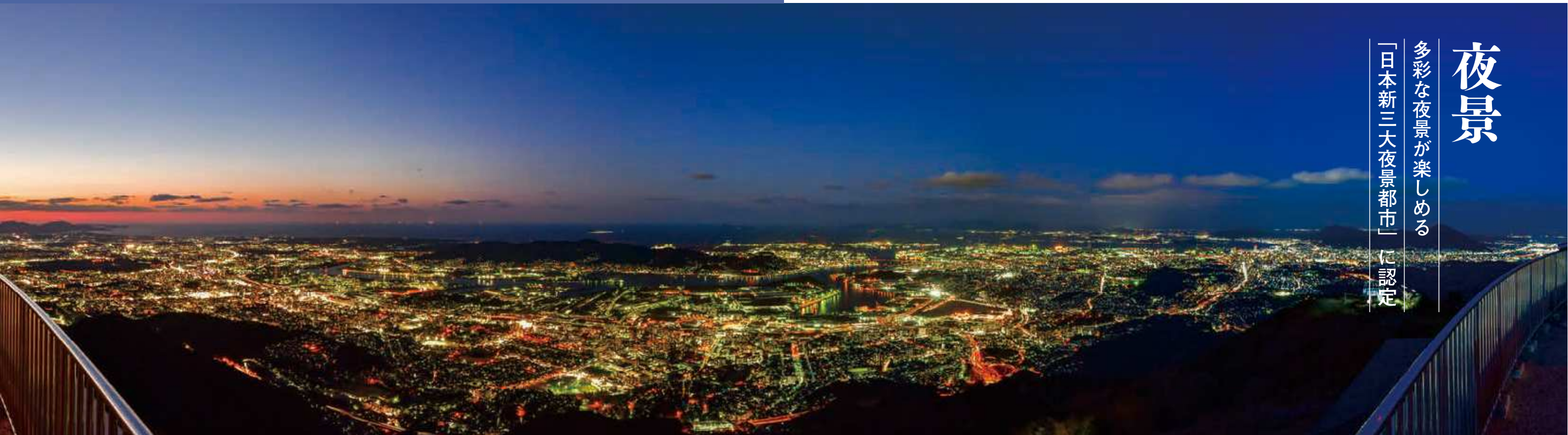
83 皿倉山からの夜景