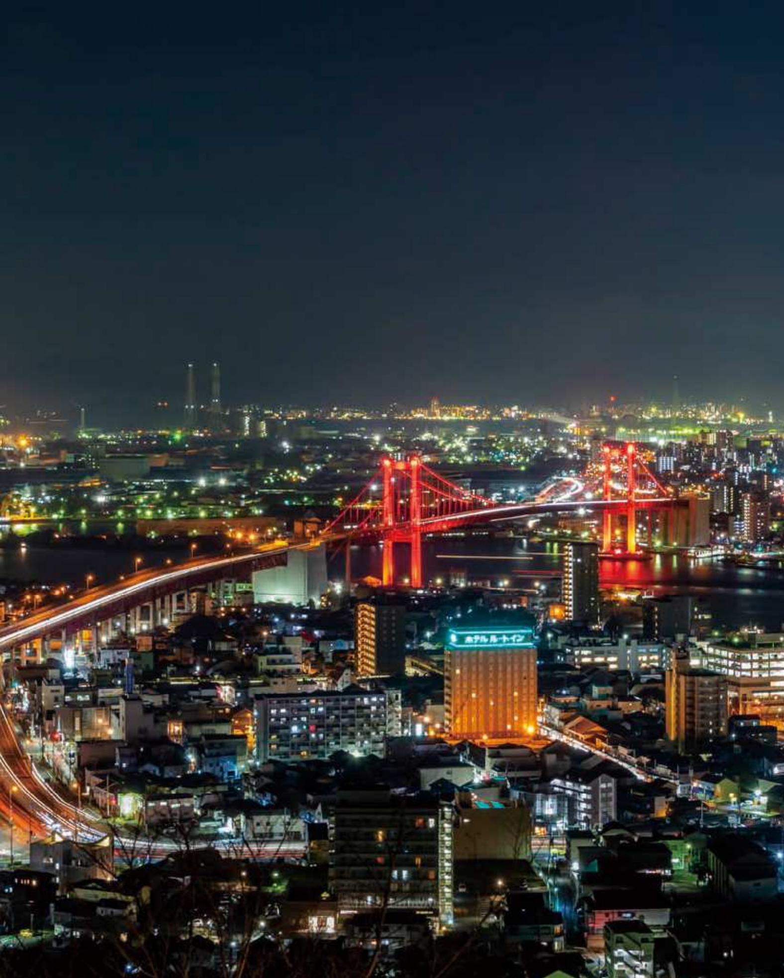
87 高塔山からの夜景