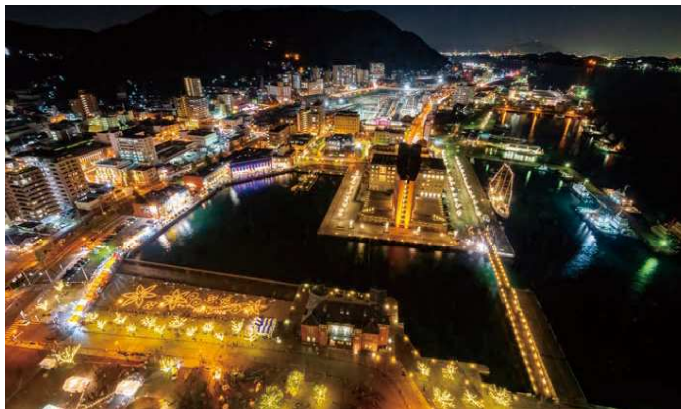
84 門司港レトロ展望室からの夜景

全国約 5,500 人の夜景観賞士の投票により、2018 年に「日本新三大夜景都市」に認定された北九州市。「皿倉山」、「高塔山」、「足立公園」、「門司港レトロ展望室」、「小倉イルミネーション」、「戸畑祇園大山笠」の 6 つの夜景遺産を有するほか、小倉城や若戸大橋、門司港レトロ地区などのライトアップ整備も進み、魅力ある夜景スポットが次々と生まれている。