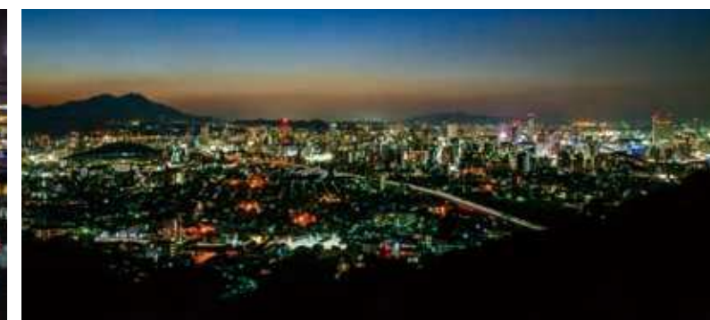
86 足立山からの夜景