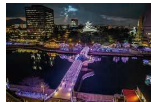
85 小倉イルミネーション

そのほか、JR 小倉駅や紫川周辺など街の各所で開催される冬の風物詩「小倉イルミネーション」や、ダイナミックな工場夜景などを船上から楽しむ「夜景観賞定期クルーズ」など、多彩な視点から光が織りなす風景を鑑賞できるのが北九州の夜景の魅力といえる。