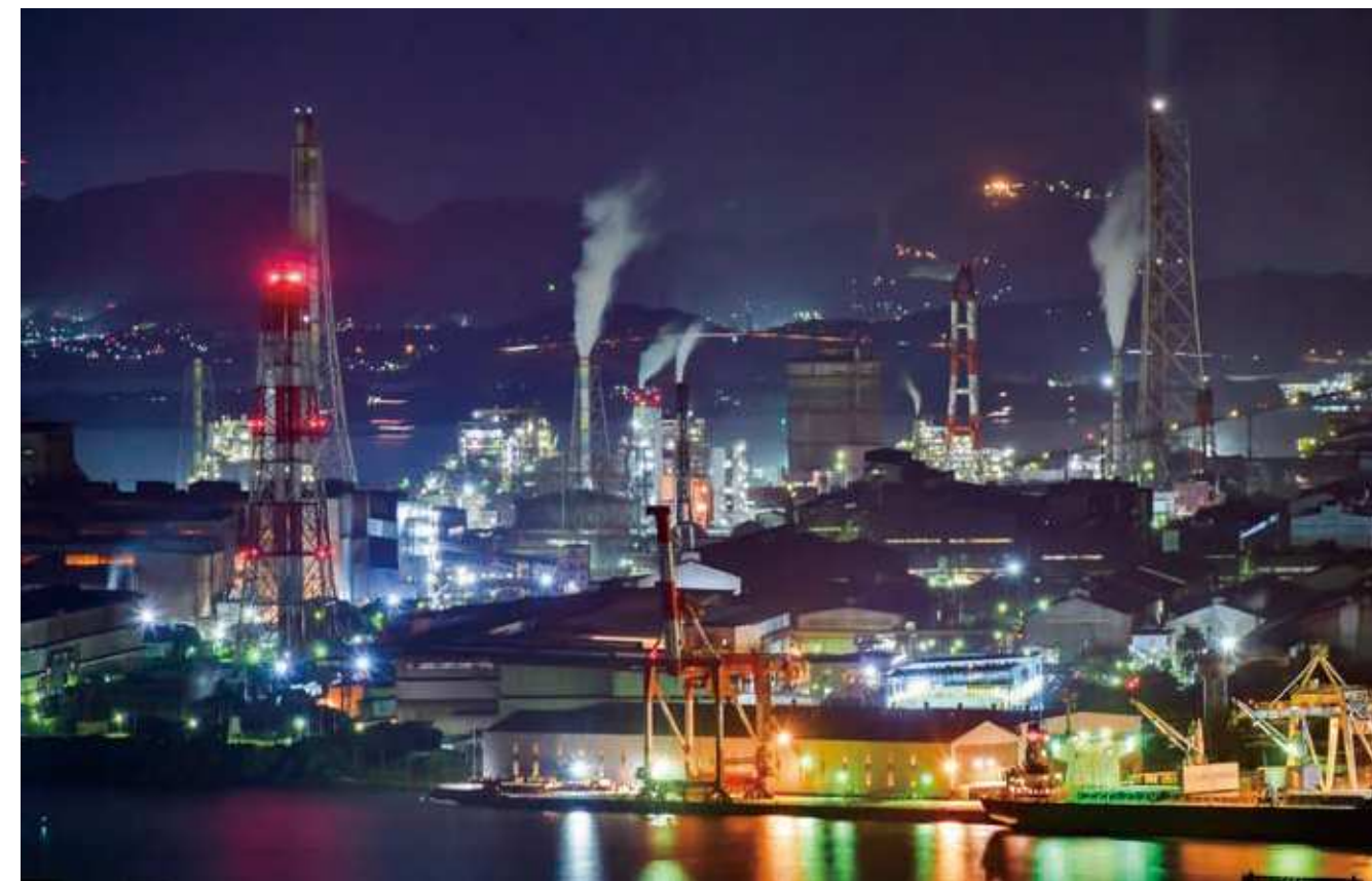
88 工場夜景 (若松区 高塔山展望台より戸畑方面をのぞむ)