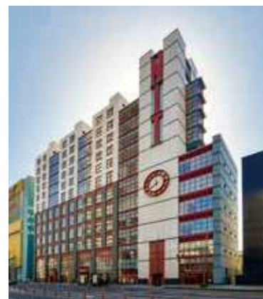
西日本工業大学 小倉キャンパス