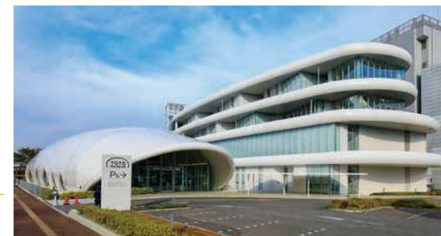
74 TOTOミュージアム 所在地/小倉北区中島2-1-1 竣工/2015年 設計/榑梓設計