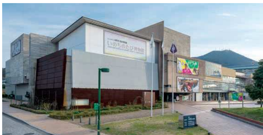
77 いのちのたび博物館 所在地/八幡東区東田 2-4-1 竣工/2001年 設計/榎久米設計