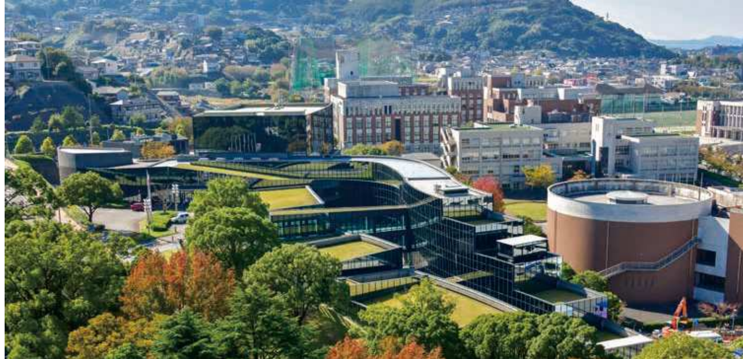
76 国際村交流センター 所在地/八幡東区平野 1-1 竣工/1993年 設計/石井・サム設計共同企業体