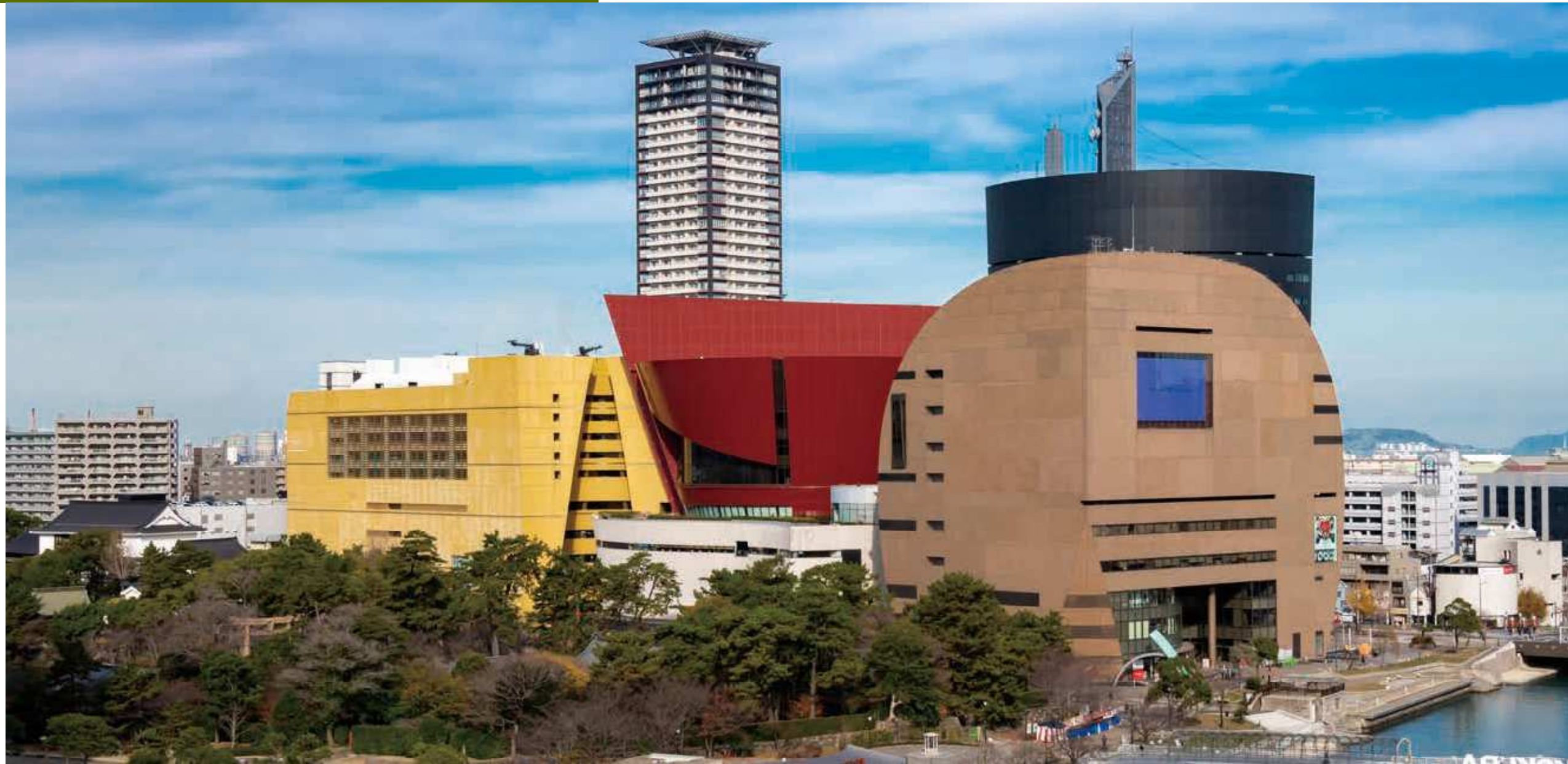
62 リバーウォーク北九州 所在地/小倉北区室町 1-1-1 竣工/2003年 設計/榎本設計 デザイン(建築):ザ・ジャーディ・パートナーシップ社

1990年代以降、北九州市の都市景観は一気に多彩な装いを帯びる。北九州市ルネッサンス構想の元、門司港レトロ地区整備や東田の八幡製鐵所跡地開発など、各地区の歴史的な文脈を生かしつつ大胆にその構造を転換させる事業を展開したためだ。中でも象徴的なのが、紫川マイタウン・マイリバー整備事業とその中核をなすリバーウォーク北九州だろう。