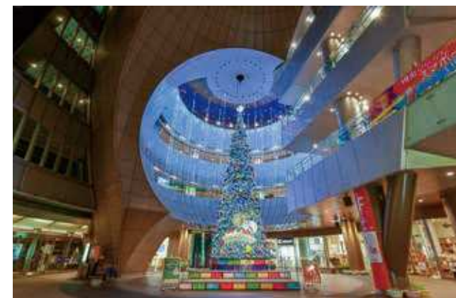
リバーウォーク北九州 クリスマスイルミネーション