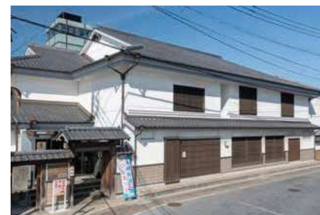
みちの郷土史料館