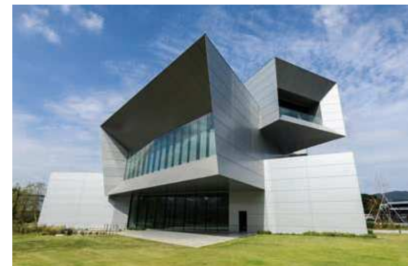
80 安川電機みらい館 所在地/八幡西区黒崎城石 2-1 竣工/2015年 設計/榎三菱地所設計