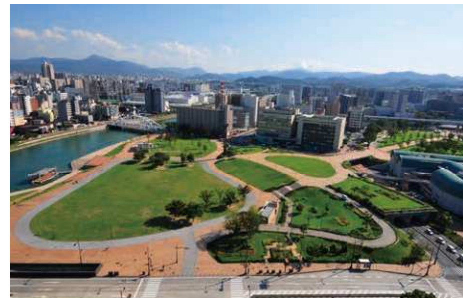
73 勝山公園周辺 所在地/小倉北区城内 竣工/2006年