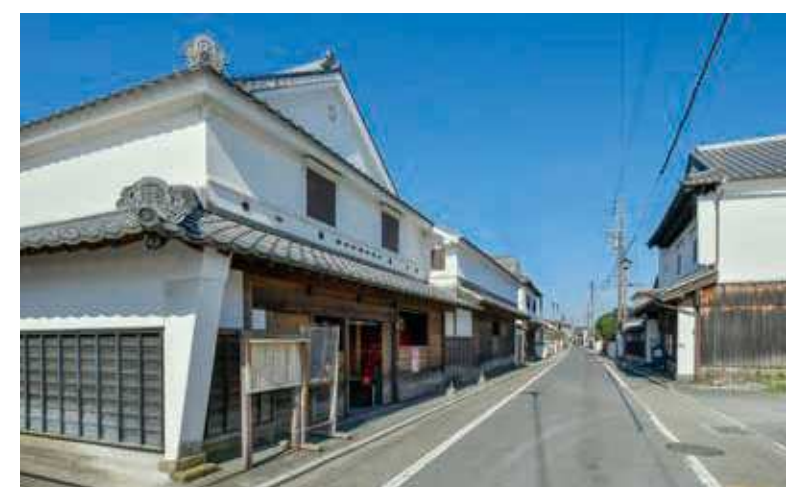
81 木屋瀬のまちなみ