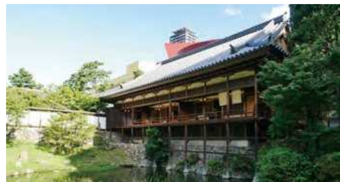
70 小倉城庭園 所在地/小倉北区城内1-2 竣工/1998年 設計/澤良雄・日向進(監修)