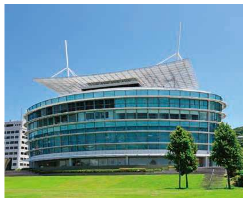
65 関門海峡ミュージアム 所在地/門司区西海岸 1-3-3 竣工/2003年 設計/環境デザイン研究所・大崎・総合設備・トーホー設備・森川設計業務共同企業体