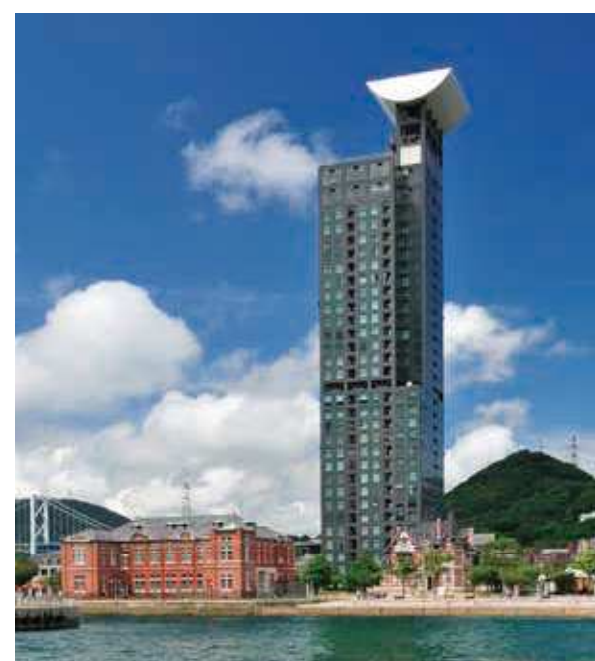
64 門司港レトロハイマート 所在地/門司区東港町 1-32 竣工/1999年 設計/黒川紀章