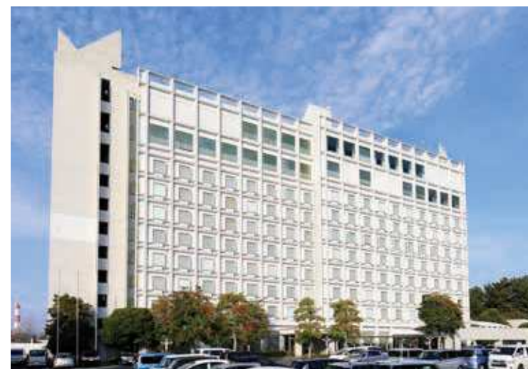
79 ホテルクラウンパレス北九州 (旧北九州プリンスホテル) 所在地/八幡西区東曲里町 3-1 竣工/1989年 設計/池原義郎・建築設計工房