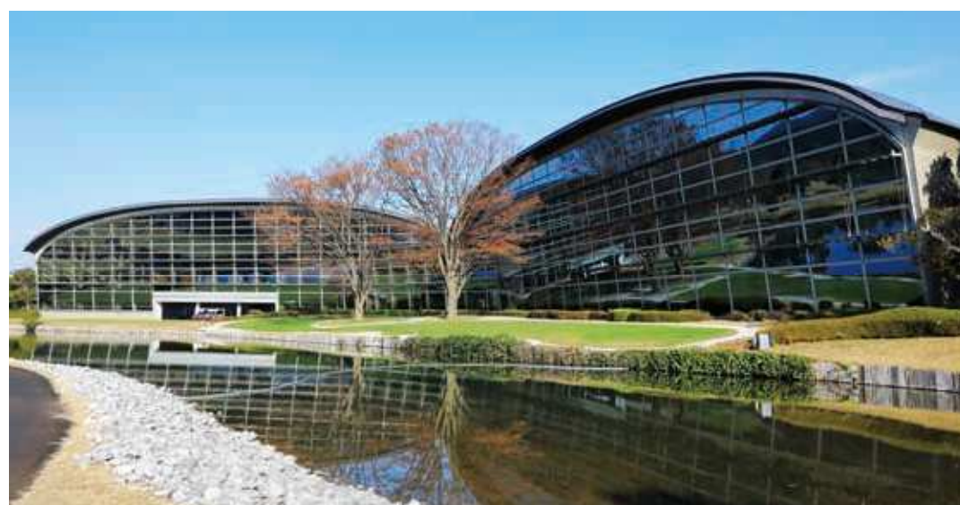
78 九州ゴルフ倶楽部八幡コース クラブハウス 所在地/八幡東区大字小野 1467 竣工/1992年 設計/黒川紀章 ※一般見学は行っていません