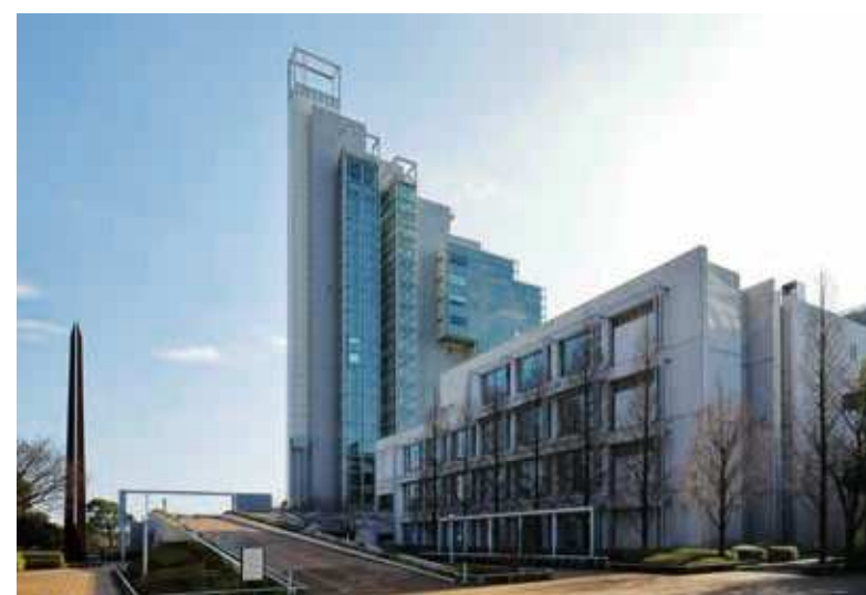
67 北九州市立大学本館 所在地/小倉南区北方 4-2-1 竣工/1995年 設計/榎池原義郎・建築設計事務所 (株)構造計画研究所