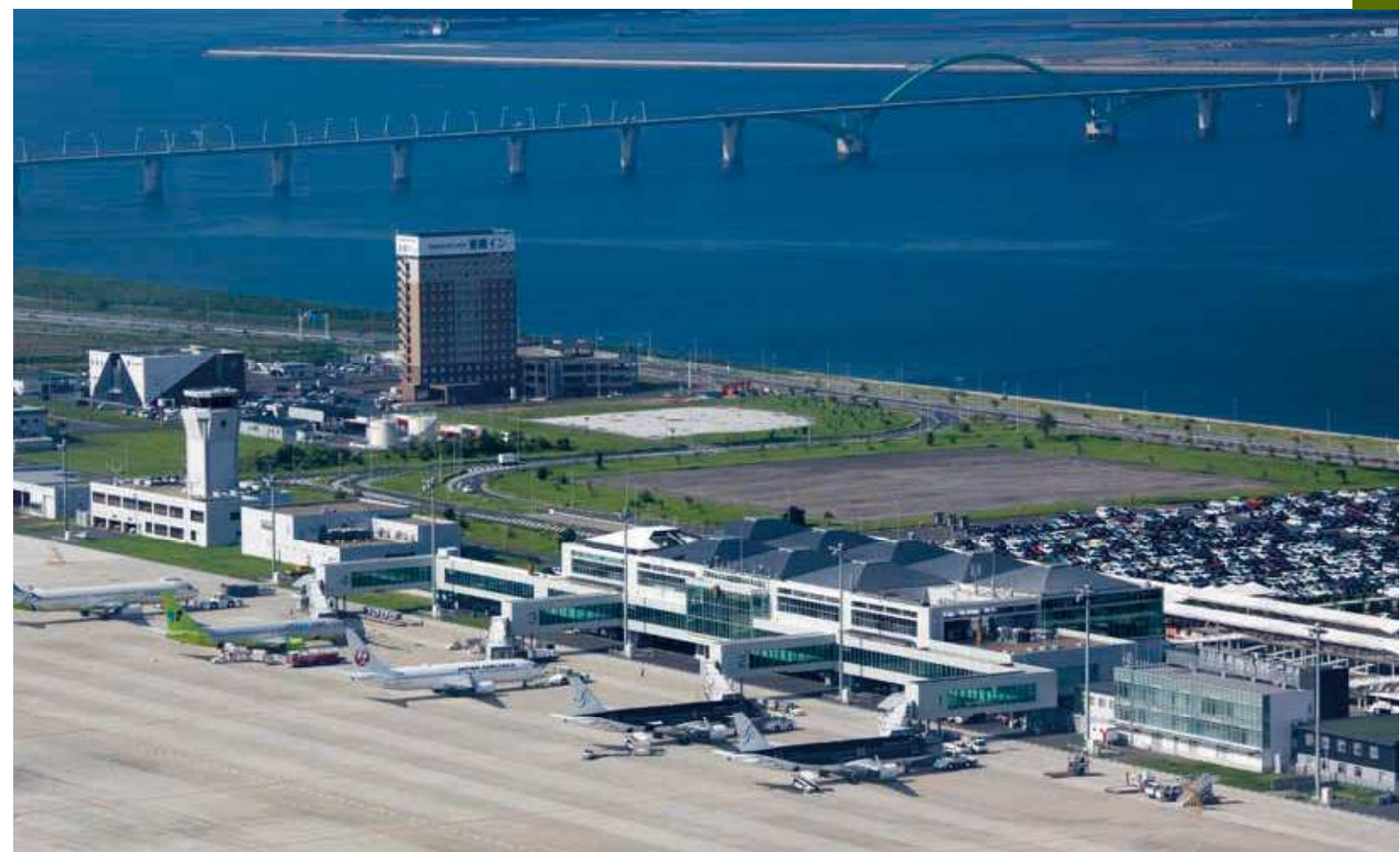
66 北九州空港旅客ターミナルビル 所在地/小倉南区空港北町 6 竣工/2006年 設計/梓・HOK新北九州空港旅客ターミナルビル設計共同企業体