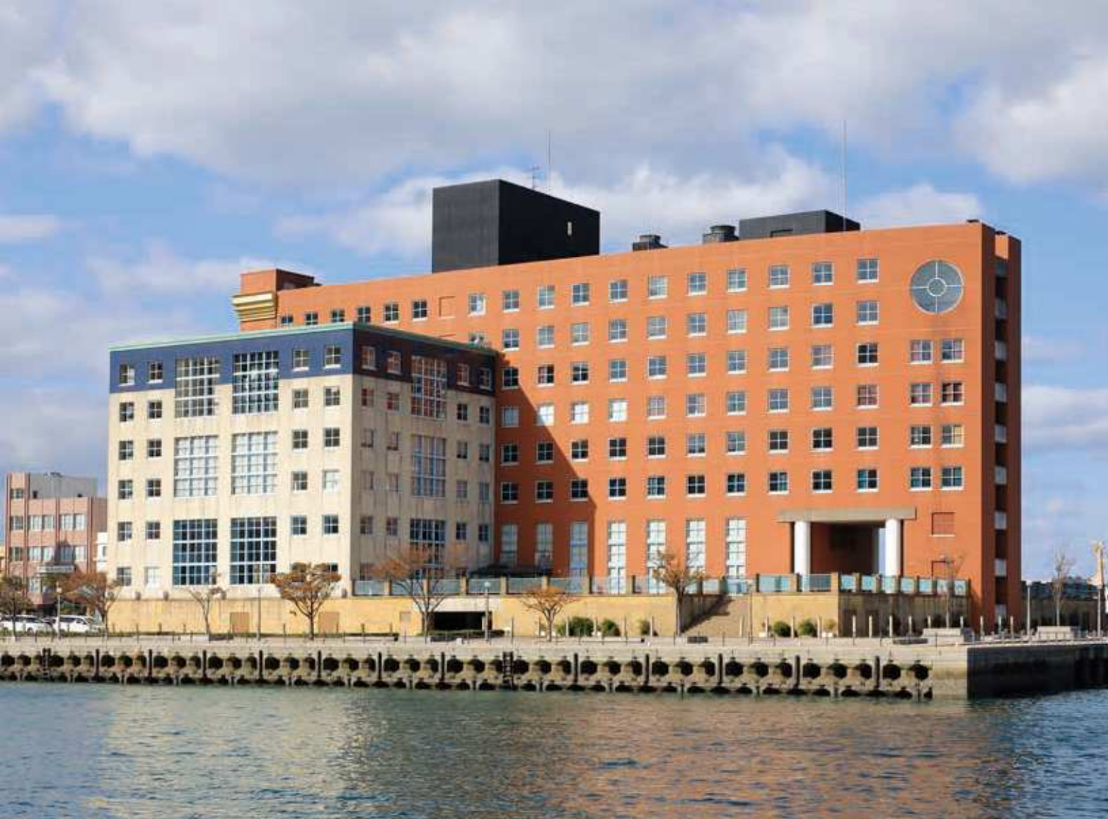
63 プレミアホテル門司港(旧門司港ホテル) 所在地/門司区港町 9-11 竣工/1998年 設計/ロッシ・アジミ・堀口+SDA (株)レック都市地域研究所 内田繁+スタジオ 80