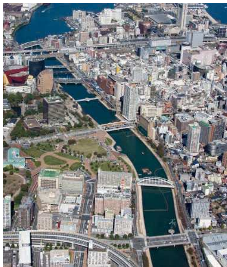
69 紫川マイタウン・マイリバー 所在地/小倉北区紫川河口～貴船橋付近 竣工/1990年