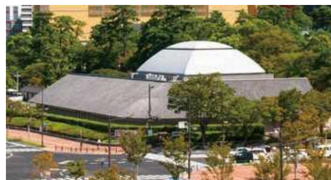
71 松本清張記念館 所在地/小倉北区城内2-3 竣工/1998年 設計/宮本忠長建築設計事務所