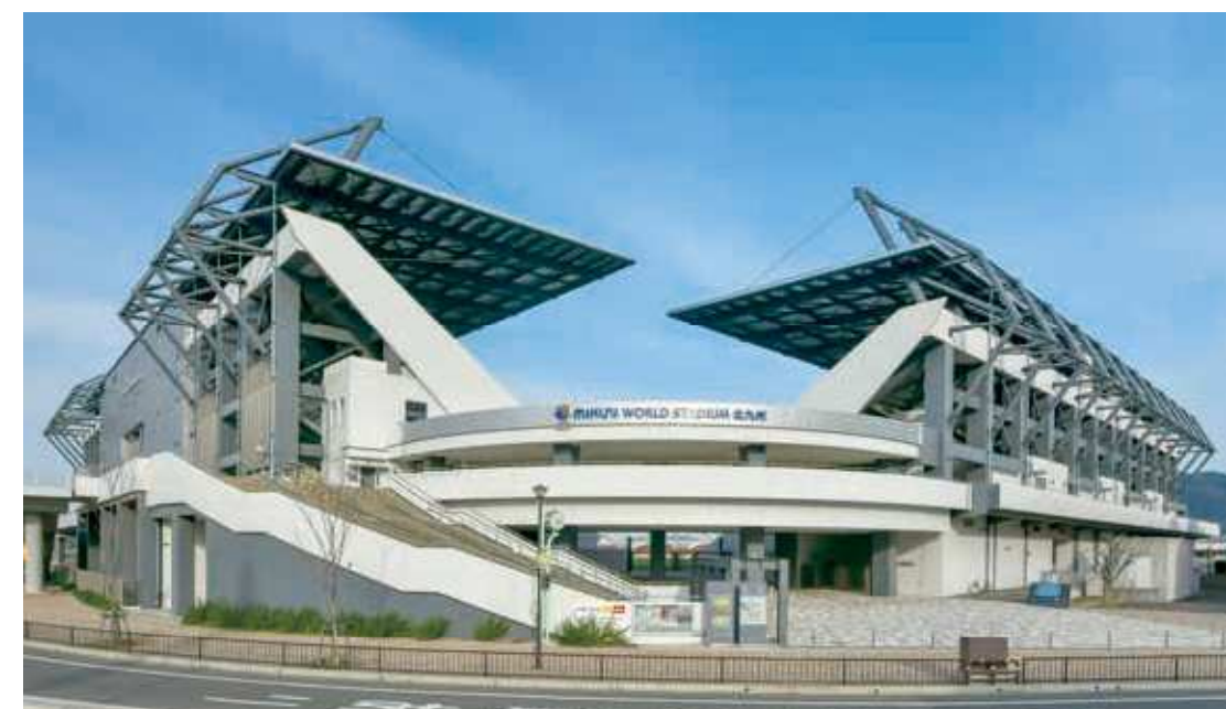
75 ミクニワールドスタジアム北九州 所在地/小倉北区浅野3-9-33 竣工/2017年 設計/榑梓設計九州支社