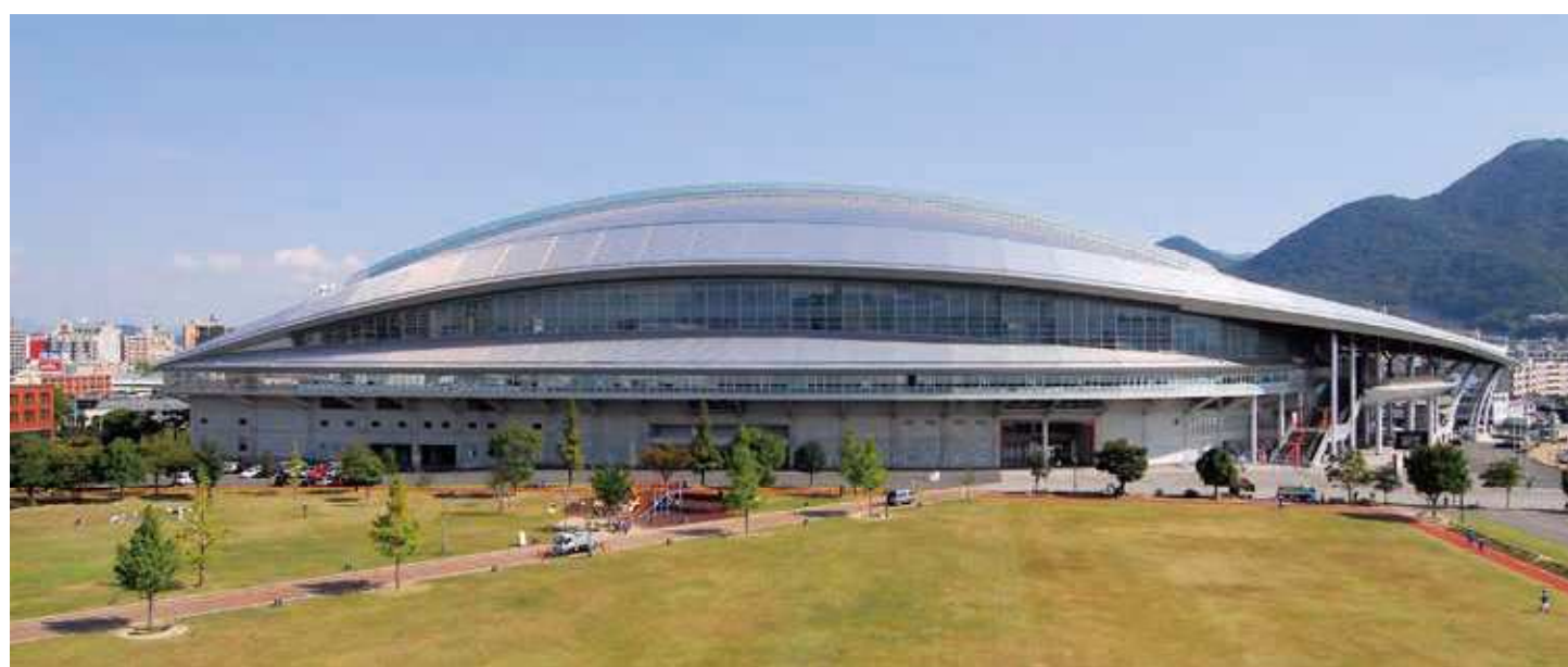
72 北九州メディアドーム 所在地/小倉北区三萩野3-1-1 竣工/1998年 設計/榑菊竹清訓建築設計事務所