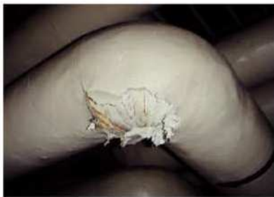
配管エルボの保温材