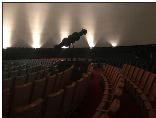
プラネタリウム内部