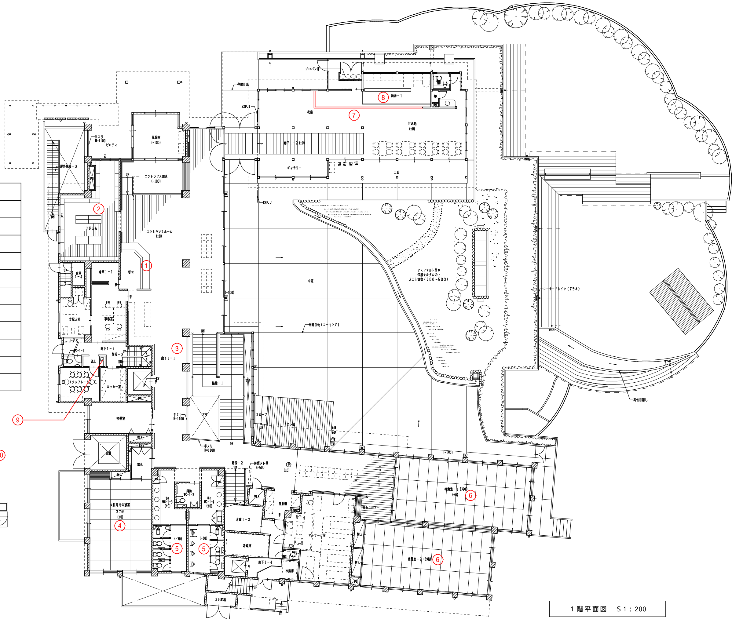
1階平面図 S1 : 200