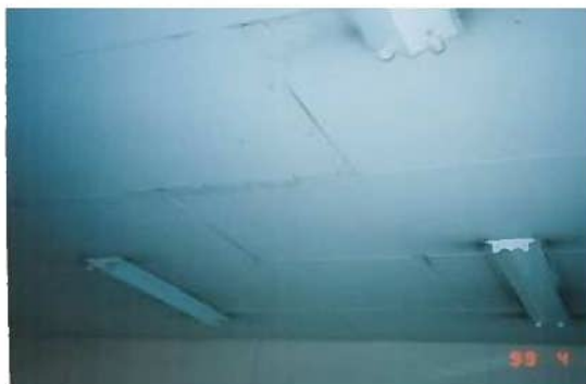
天井のスレート板