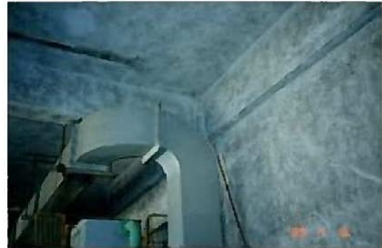
機械室の壁・天井の断熱