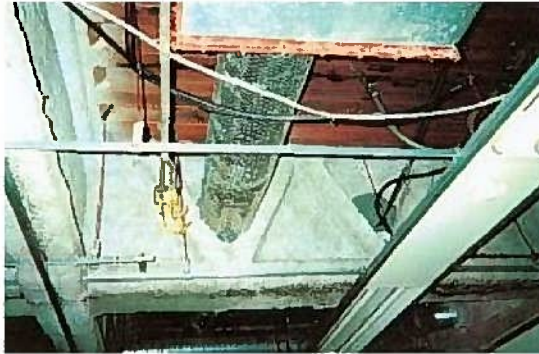
鉄骨造の梁・柱の耐火被覆