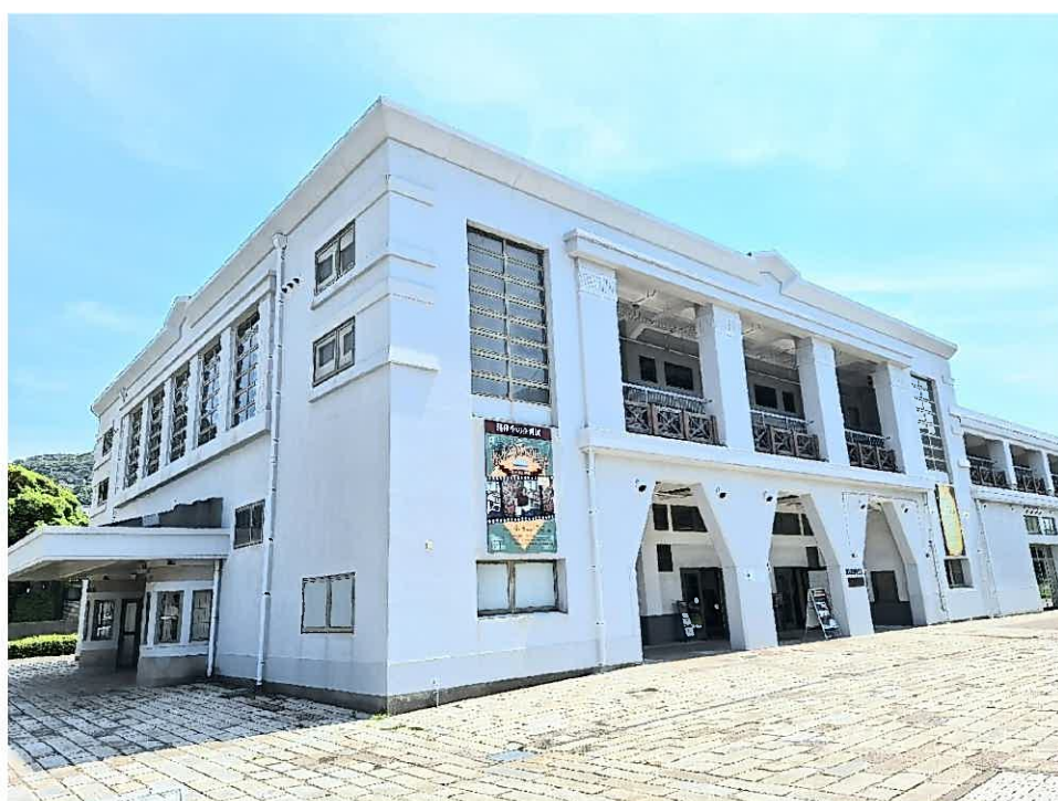
きゅうだいにんこうろうわや 旧大連航路上屋

「門司税関1号上屋」として昭和4（1929）年に門司区西海岸に建設。国際ターミナルとして、第二次世界大戦の終戦で航路が断絶するまで重要な役割を果たしてきた。中国・大連行きフェリーが多かったため、「大連航路上屋」と呼ばれた。幾何学模様を取り入れたアール・デコ調のデザインが特徴的。1階の正面ファサードにはチケット売り場と思われるブースが設けられている。