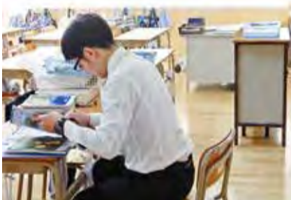
▲空いた時間を活用して授業の準備などを行います。