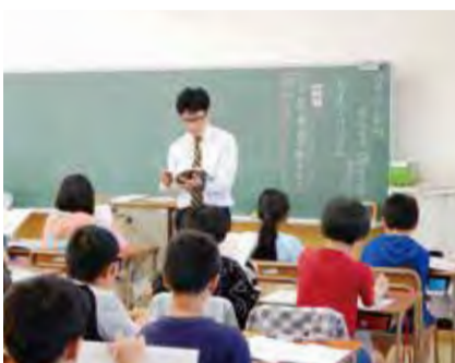
▲担当教科の授業を複数のクラスで行います。

上記により、授業の準備やテストの採点、より深い教材研究を行う時間が増えます。また、他の教員の授業を見ることで、授業スキルを向上させることが期待できるため、子どもの学びの質の向上に繋がります。