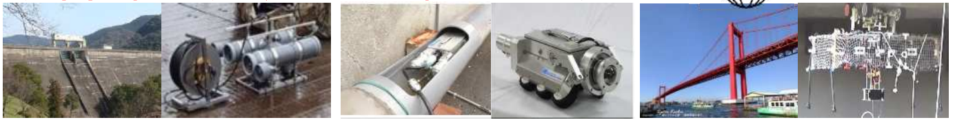
ダム堤体、護岸 【潜水ロボット】 上下水管、プラント配管 【管渠点検ロボット】 橋梁、トンネル 【飛行型点検ロボット】

ONE STOP Support Center for Demonstration Tests