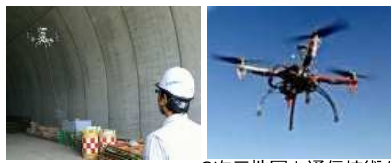
インフラ点検実証