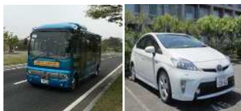
自動運転バス・一般車両公道実証