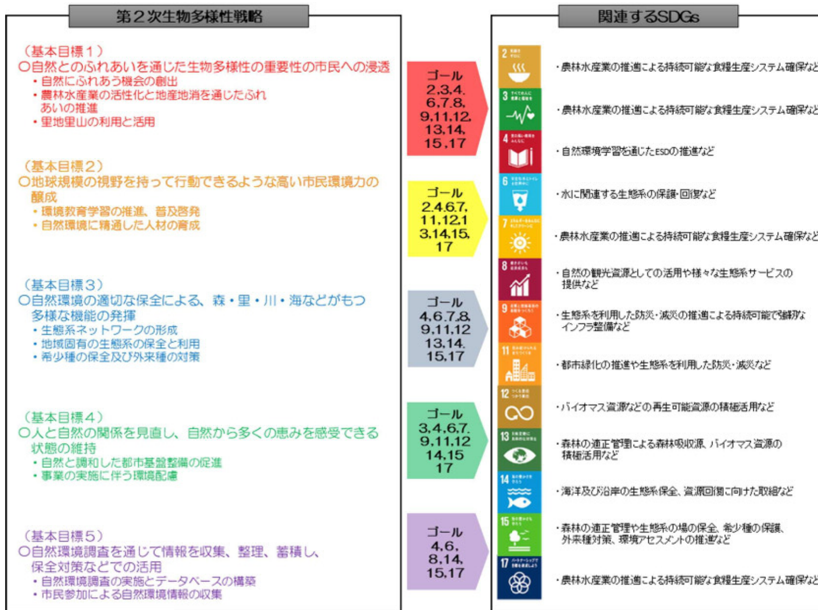
(図) 生物多様性戦略と環境基本計画、SDGs について