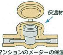
マンションのメーターの保温