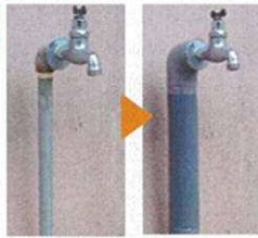
保温チューブの取付