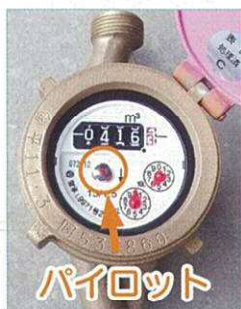
パイロット 水道メーター（拡大）

③水道の元栓を閉めて、上下水道局の指定給水装置工事事業者へ修繕について相談しましょう。修繕に係る費用はお客さまのご負担となります。「どの業者を選んだらよいかわからない」という場合は、「地元密着型水道修繕工事店」をご利用ください。