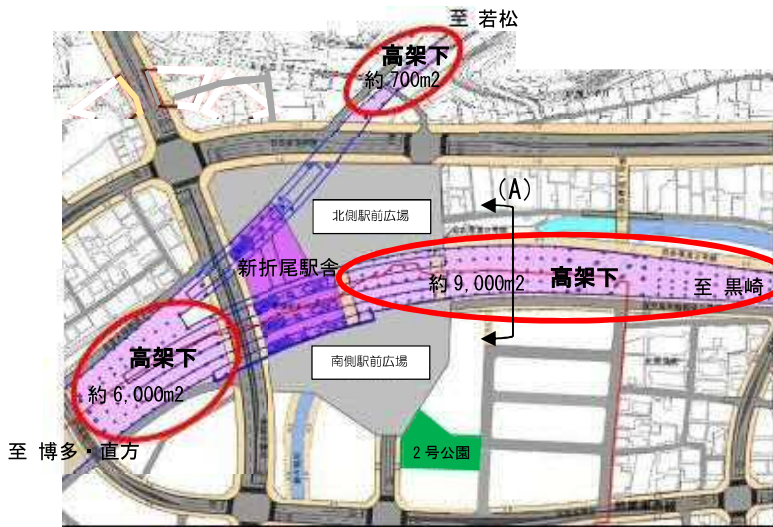
折尾駅高架下 位置図