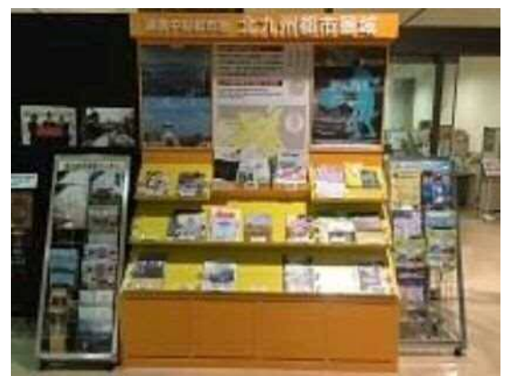
市民ホール(北九州都市圏域コーナー)