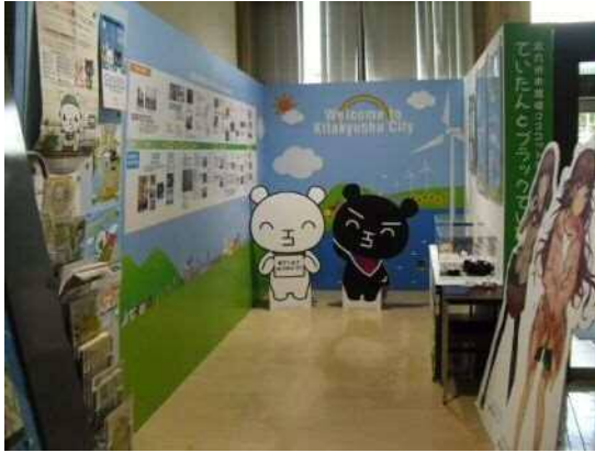
市民ホール(ていたんコーナー)