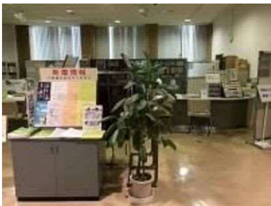
広聴課(相談コーナー)