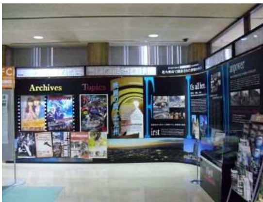
市民ホール(フィルム・コミッション)