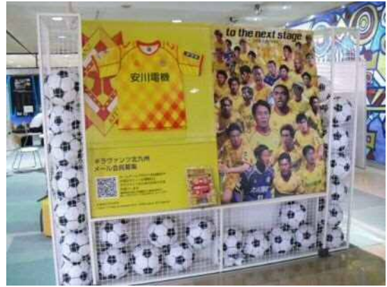
市民ホール(ギラヴァンツコーナー)