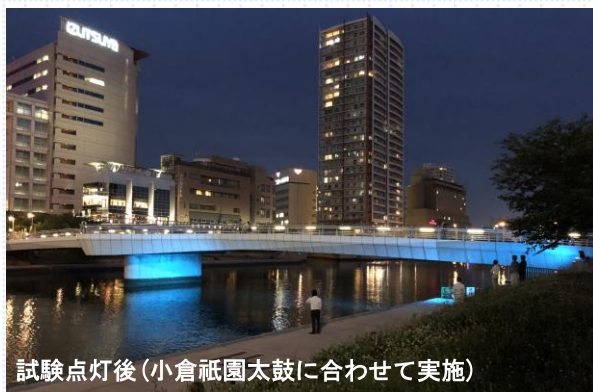
試験点灯後(小倉祇園太鼓に合わせて実施)