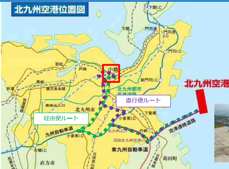
北九州空港位置図