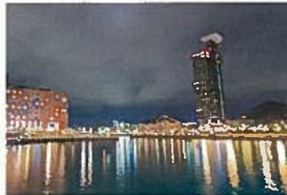
浪漫灯彩（イルミネーション）

テキストテキストテキストテキストテキスト テキストテキストテキストテキストテキスト テキストテキストテキストテキストテキスト テキストテキストテキストテキストテキスト テキストテキストテキストテキストテキスト テキストテキストテキストテキストテキスト テキストテキストテキストテキストテキスト テキストテキスト