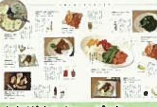
◆オリジナルメニューブック