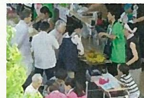
もやい通りマルシェ