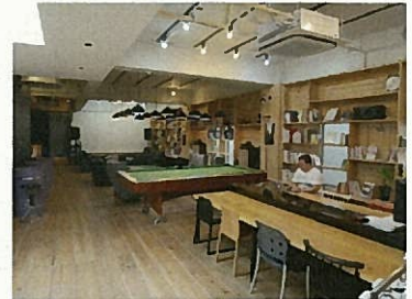
■ コワーキングスペース「秘密基地」