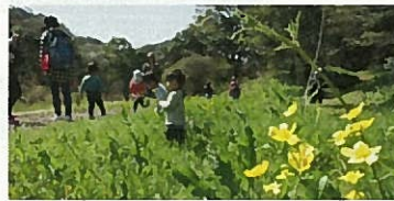
■ 育児サークル「響の森」