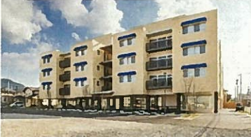
■ 銀杏庵穴生倶楽部