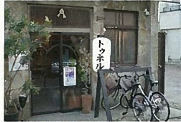
■ ゲストハウス「トゥネル」