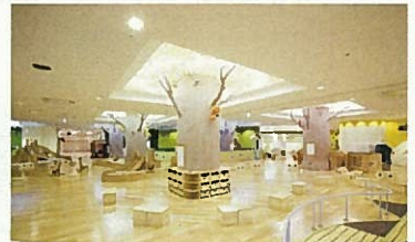
■ 子育てふれあい交流プラザ「元気のもり」