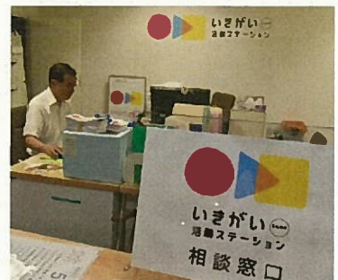
■ いきがい活動ステーション