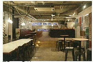
■ Tanga Table