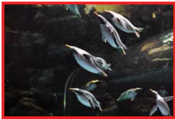
(イメージ)