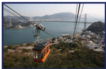
(イメージ)