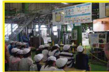
(イメージ)

人にも環境にもやさしい無添加石けんにこだわり続けるシャボン玉石けんの原料・製法・特徴や、実際に作られている石けんの製造工程を見て・触れて・感じて楽しく学べます。(工場内は段差等がありますのでスリッパ・サンダル等はご遠慮ください)