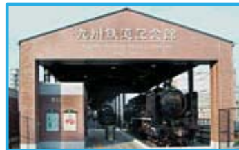
(イメージ)

建物は1891年に建築された赤レンガ造りの初代九州鉄道本社社屋が使われており、屋内には九州鉄道で使われていた車両の展示、大きな鉄道模型(ジオラマ)、疑似運転体験ができる運転シミュレーター等また、屋外には九州各地で活躍した歴代の実物車両(8車両)が展示されています。