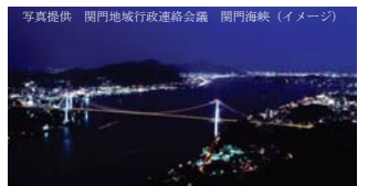
関門海峡 (イメージ)