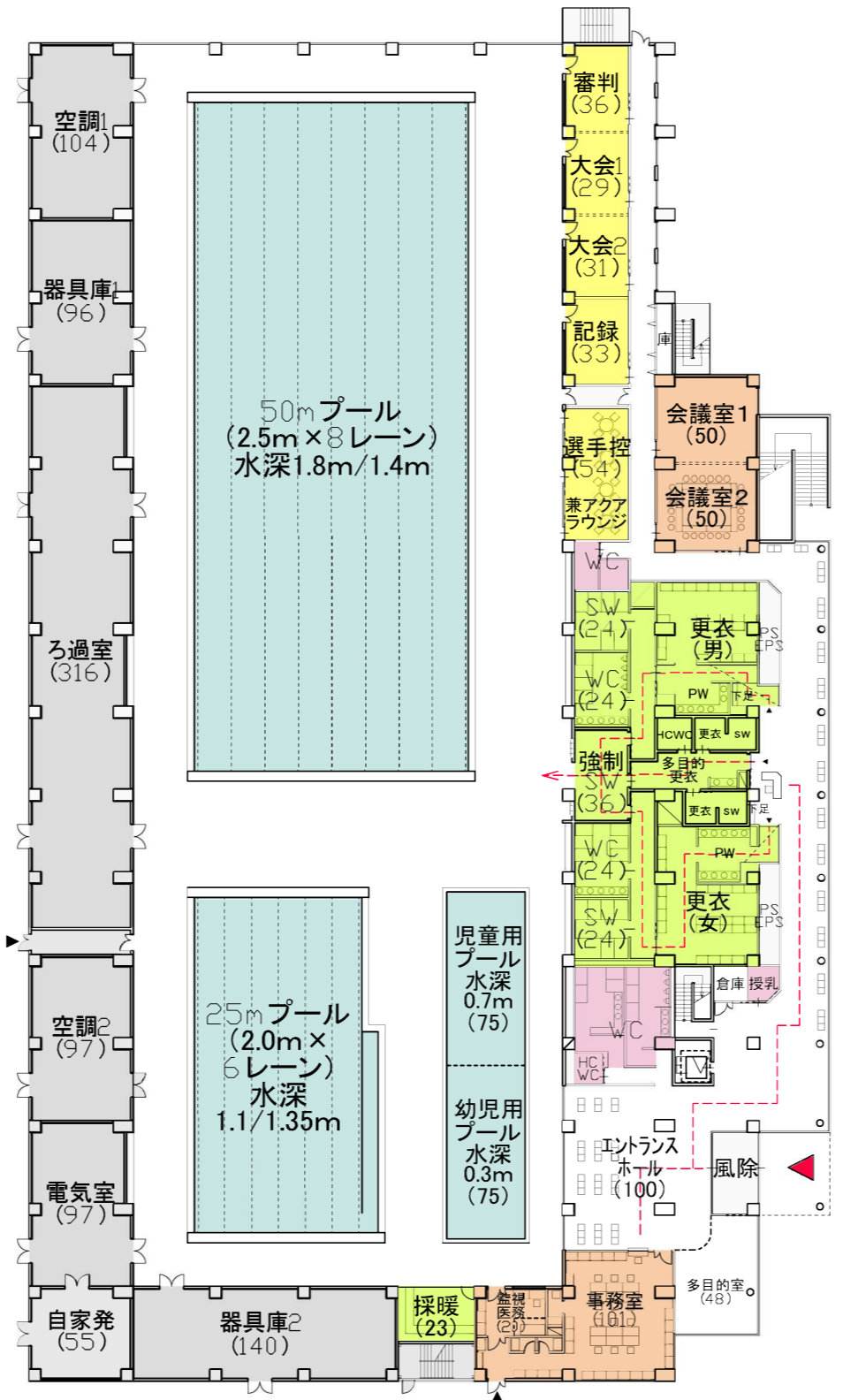
1階平面図 (A3 1/500)