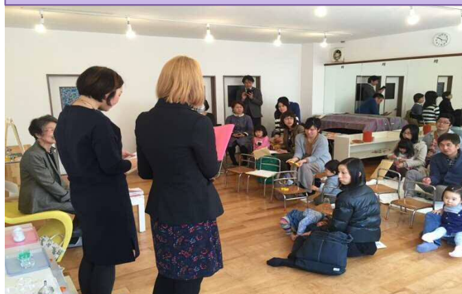
英語モンテッソーリ教育 「カーサ・デ・バンビーニ」