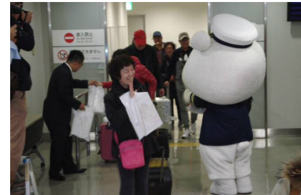
大連線初便 到着風景