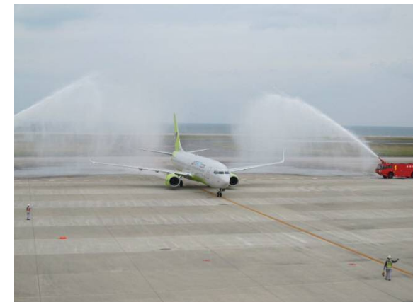
釜山線初便 歓迎放水