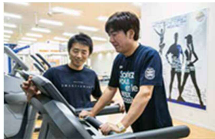
高ストレス者へのトレーニング提供