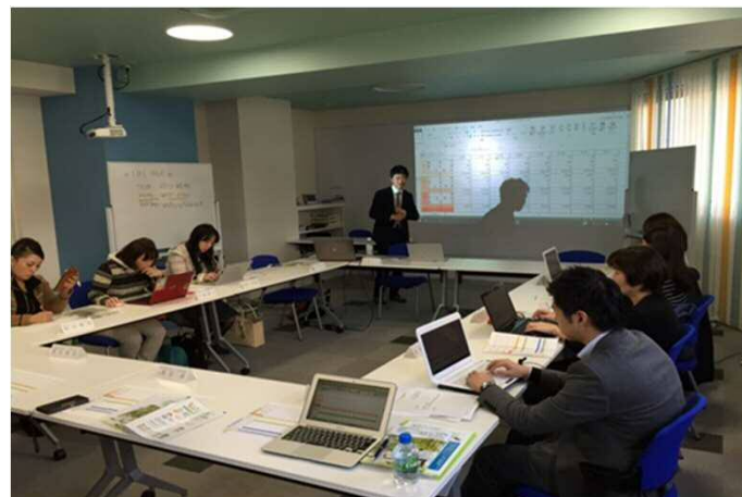
サロン事業者を対象とした 税理士による生産性向上セミナー