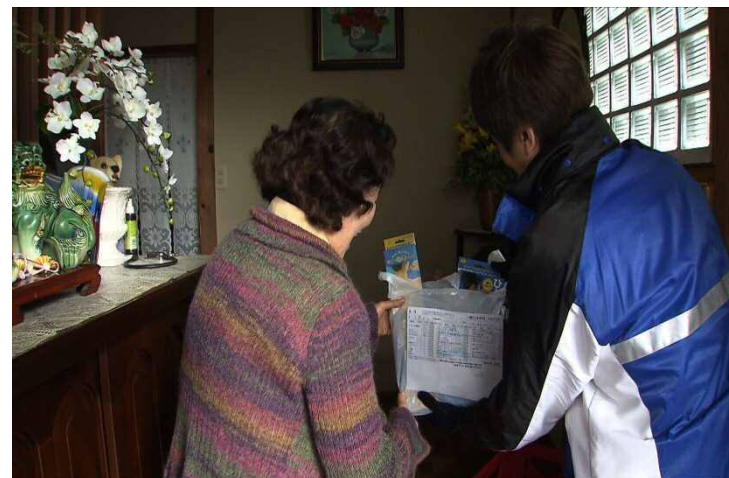
買物弱者支援のための御用聞き事業