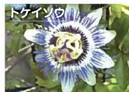
その形が名前の由来。別名パッションフラワー(6～9月)