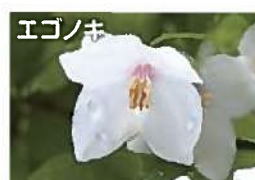
名前の由来は、実の味がエグいため。(5～6月)