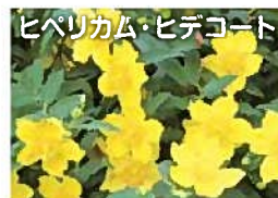
明るく輝くような黄色の花です。(6～9月)