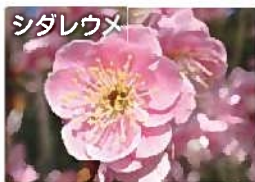
到津遊園時代から一番乗りで春を告げる花(2月～3月中旬)