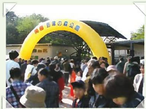
15年前の開園当時の正面ゲート

当時から一番大きく変わった点は、コンクリートの床に狭い檻だったのが、床が土になり、檻の中に樹木を植え、緑豊かな自然の中で生き生きと暮らす動物たちの姿を見ることが出来る事です。