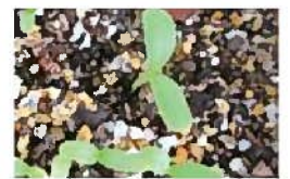
プリムラ・マラコイデスの発芽

園芸店では、3月に入ると早春の草花、4月に入ると初夏からの草花が「所狭し」と並びます。お気に入りの草花は手に入りましたか? 「この花のあの色で～」ちょっと拘ってみたい場合、そんな時は「種蒔き」をしてみませんか。もちろん、「これ好き!」という草花の種子を探さなければいけません。これも楽しみの一つですね。春蒔きの草花は一定の気温があれば発芽し生育をします。花苗になるまで少し時間がかかりますが、その分愛着も! 詳しくお知りになりたい方は「相談所へGO!」 相談員: 御園