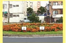
種まき指導・植付指導 ◆ マリンゲートもじ前(ロータリー内花壇) ◆ 参加学校: 門司海青小学校・門司中央小学校