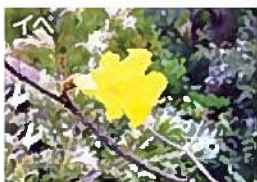
園で一番珍しいのはコレ！ (4月下旬～5月上旬)

※市民ボランティア「森の仲間たち」の皆さんが植物調査にも参加協力くださいました。