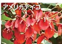
トロピカルな嵐紅の花びら (6月中旬～8月)