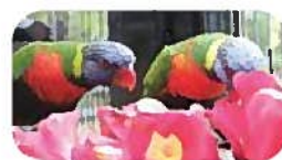
椿のお花を食べる ゴシキセイガイインコ