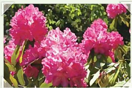
セイヨウシャクナゲ

当時から一番大きく変わった点は、コンクリートの床に狭い檻だったのが、床が土になり、檻の中に樹木を植え、緑豊かな自然の中で生き生きと暮らす動物たちの姿を見ることが出来る事です。