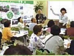
◆ 勝山公園グリーンエコハウス