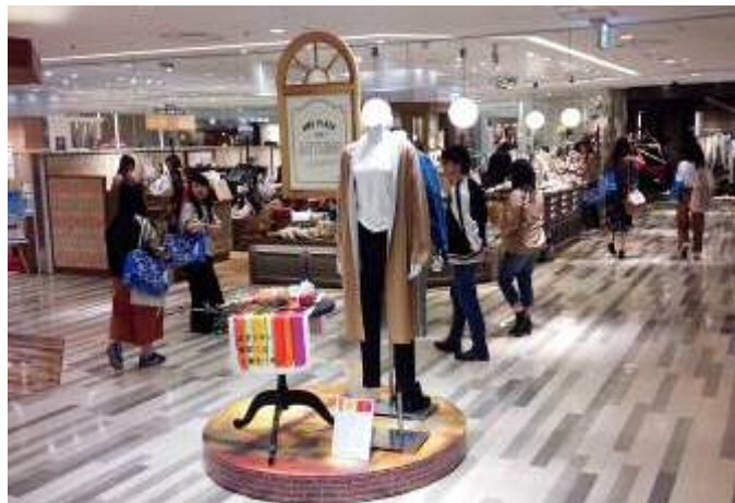
TGC終了後、青いお土産袋を持った来場者が、アミュプラザ小倉でショッピング

◇井筒屋協賛により、コレット井筒屋出店ブランドによる「 COLLET×小倉井筒屋新館ステージ 」を開催