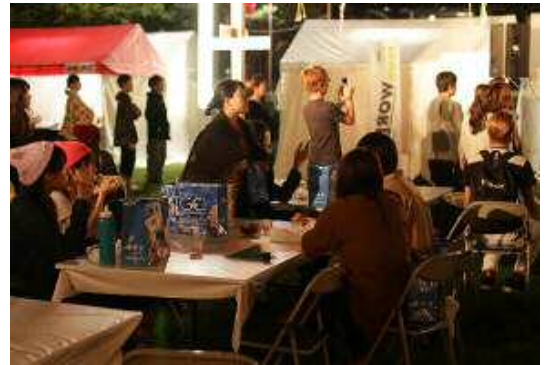
土産袋を持ったTGC来場者も飲食を楽しんだ