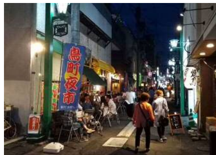
②魚町 11 号線