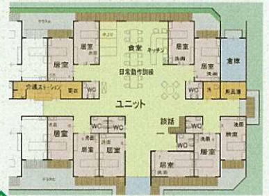
これまでの介護施設