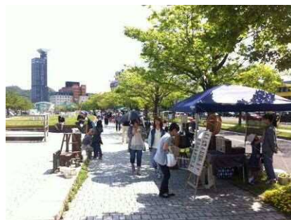
⑤西海岸 7 号線