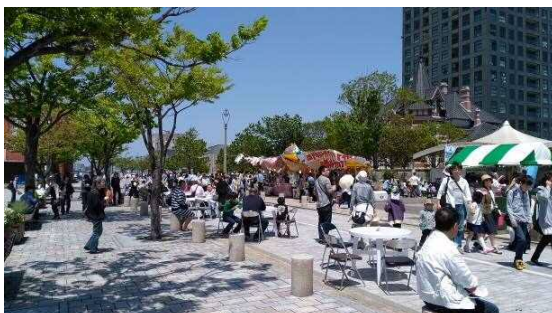
④東港町 2 号線