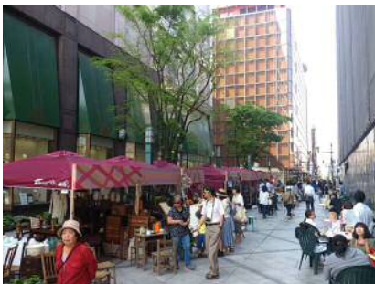
①船場町 1・6 号線