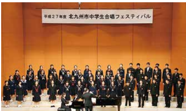
各学校の代表で結成した「フェスティバル合唱団」