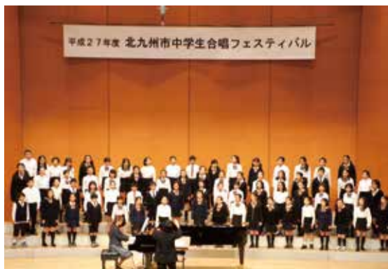
小学校合唱部の合同合唱