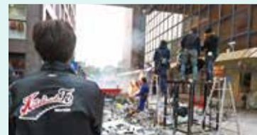
北九州フィルム・コミッション