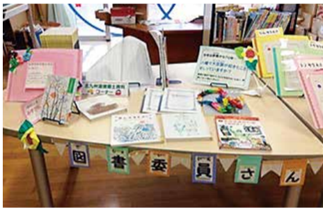
花尾小学校・学校図書館

子どもの読書活動の推進拠点として、また子ども向け専門図書館として、良質な資料を豊富に収集・提供し、市立図書館による児童サービスの統括機能、学校図書館支援センター機能、関係機関との連携の推進など、様々な支援を行う「子ども図書館」を整備します。 プランの概要については、別途学校等を通じてリーフレットを配布します。 また、出前講演等も行いますので、新年度の家庭教育学級において、子どもの読書を題材にした講座の企画など、読書を楽しいと感じ、積極的に読書活動を行う子どもを増やすために皆さまのご協力をよろしくお願い致します。