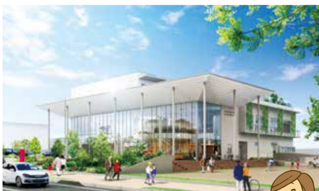
小倉南図書館（イメージ）