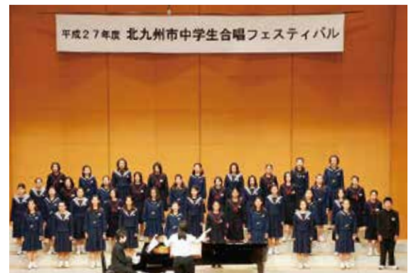
メインの中学校合唱部によるブロックごとの合同合唱