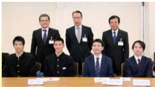
■贈呈式(平成27年12月25日) 前列:杉浦奨学生 後列:審査委員

平成4年度に事業を開始して以来、平成26年度までに137名が杉浦奨学生として採用され、過去の奨学生の中には、オリンピック代表や世界大会・アジア大会に日本代表として出場された方、国内外での音楽活動など輝かしい実績を挙げている方などが多数おり、平成27年度杉浦奨学生も今後の更なる活躍が期待されます。