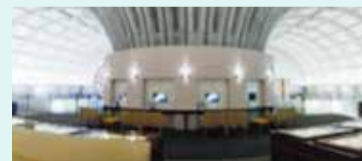
北九州市立文学館