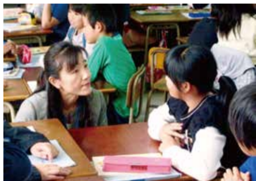
市内小学校の授業風景