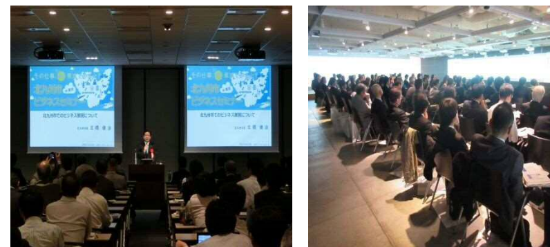
企業立地支援セミナー（東京）