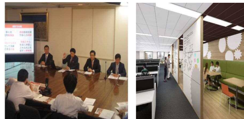
（株）メンバーズ「ウェブガーデン北九州」開設発表