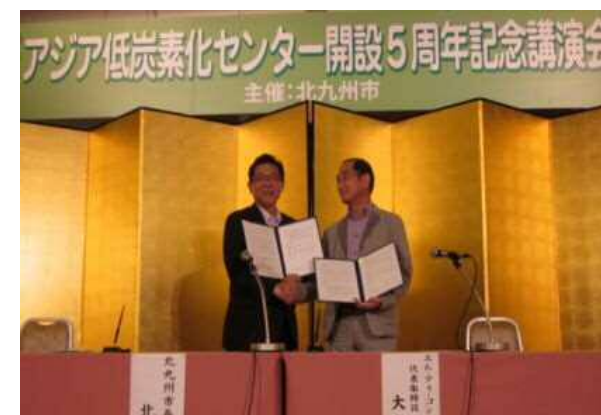
包括連携協定締結式