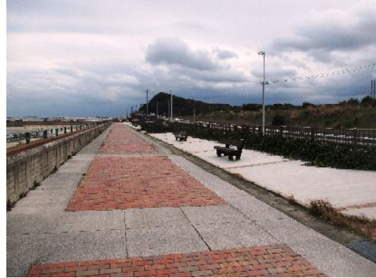
護岸上部のベンチとテーブル