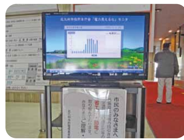
毎日の取り組みを本庁舎1階ロビーにて掲示