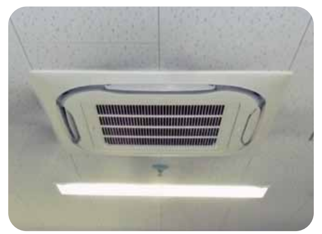
高効率空調への更新