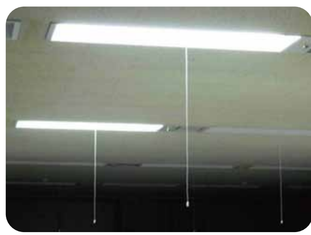
照明の間引きや引き紐スイッチの設置