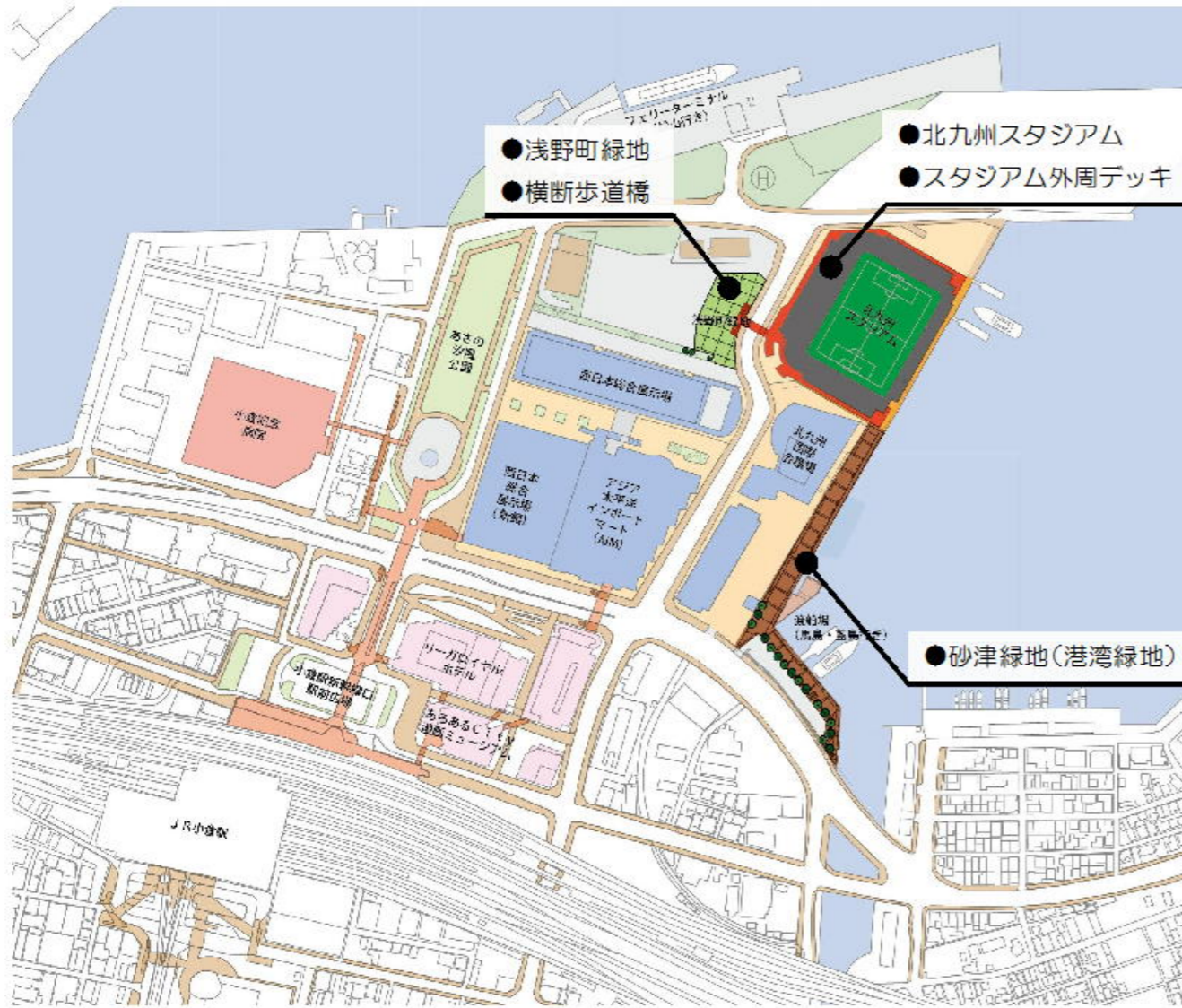
▼賑わい施設の整備箇所

新幹線口地区全体の賑わい創出、さらに都心全体の賑わいに広げるため、賑わい施設の整備を行い、回遊性の向上を図る。