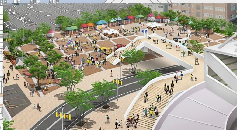
【イメージ図】 (仮称)浅野町緑地、横断歩道橋