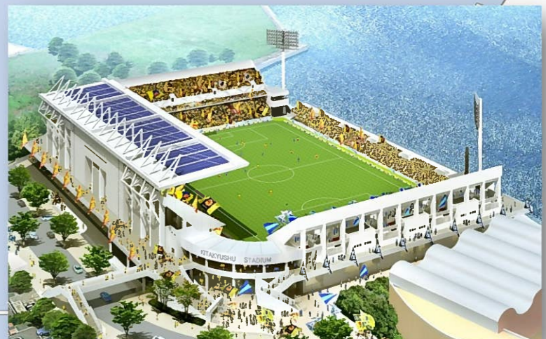
【イメージ図】 北九州スタジアム