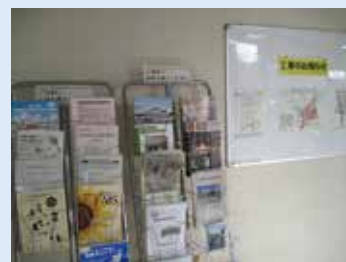
事業に関するパンフレット