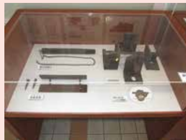
駅舎で使用されていた「部材」