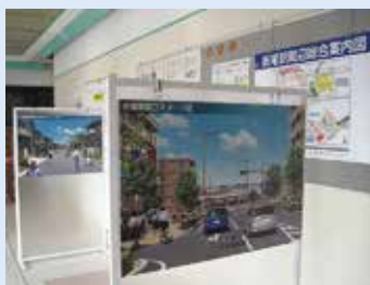
将来イメージポスター