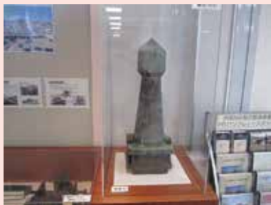
屋根に設置されていた「棟飾り」