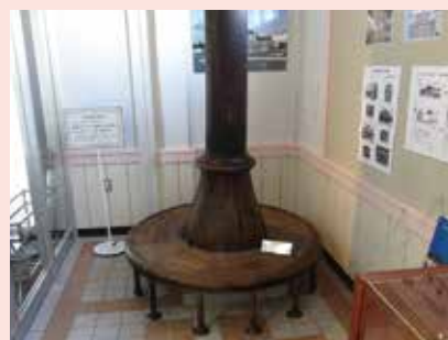
待合室にあった「円形ベンチ」