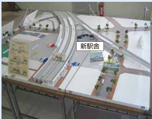
駅周辺将来完成予想模型