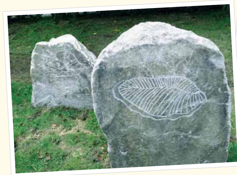
様々なオブジェにより地球の歴史を再現