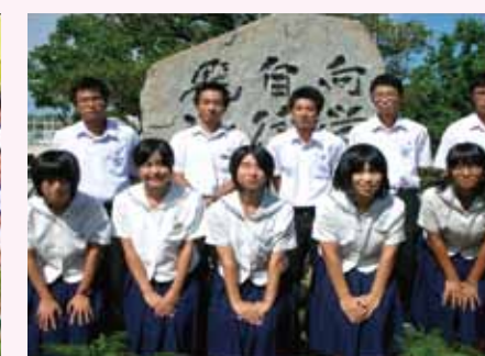
福岡県立 北筑高等学校