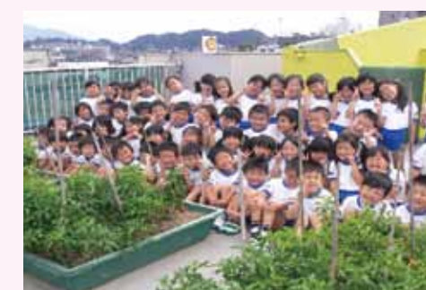
学校法人高見学園 高見幼稚園