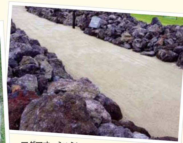
マグマオーシャン